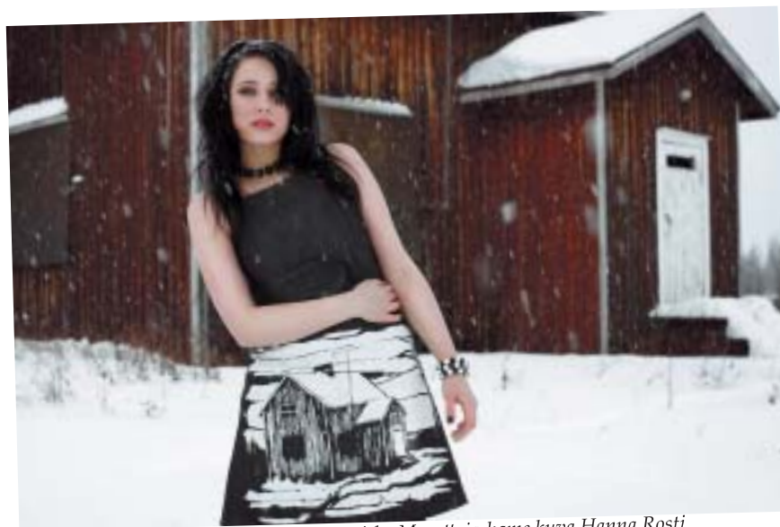
Mieland Stalingrad cowgirls, Morottaja-hame

”Olipa kerran koossa joukko ihmisiä, jotka miettivät miten pysyä elossa pohjoisessa. Talvi on kylmä ja kesäkin ailahtelevainen. Lämmintä vaatetta siis olla pitää eikä mitään liikoja röyhelöitä, että ne saa helposti päältä pois saunaan mennessä. Mutta hyvännäköisiä tietenkin, sillä eihän Lappi pelkkää hillajänkää ole.”