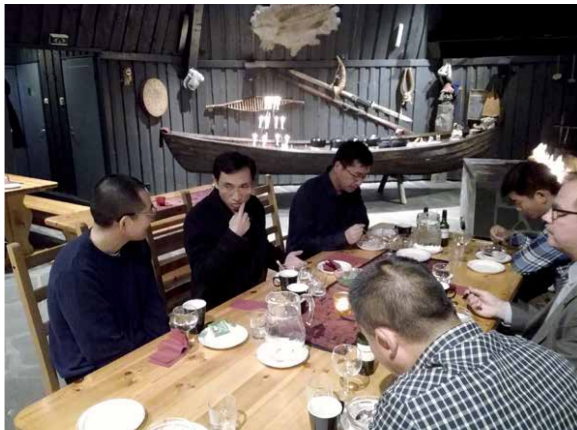
Sallalaiset yritykset esittelivät toimintaansa kiinalaisille matkanjärjestäjille Poropuistossa.

Kiinalaiset harvoin viipyvät yhdessä kohteessa useita vuorokausia.