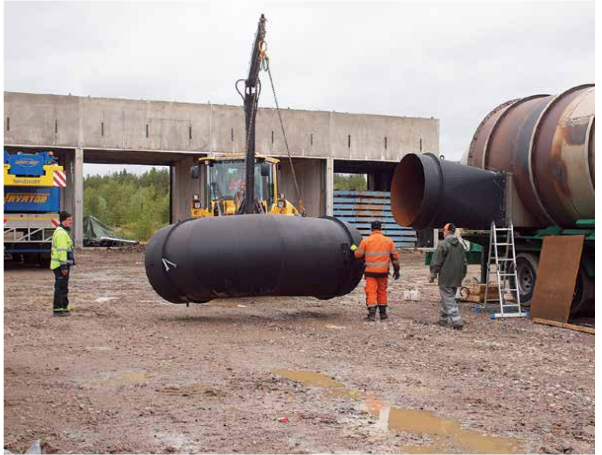
Kursun saha-alueen maat puhdisti vuonna 2015 rovaniemeläinen Savaterra Oy. Alueelle toivotaan nyt uutta yrittäjää. Kyselijöitä on jo ollut.