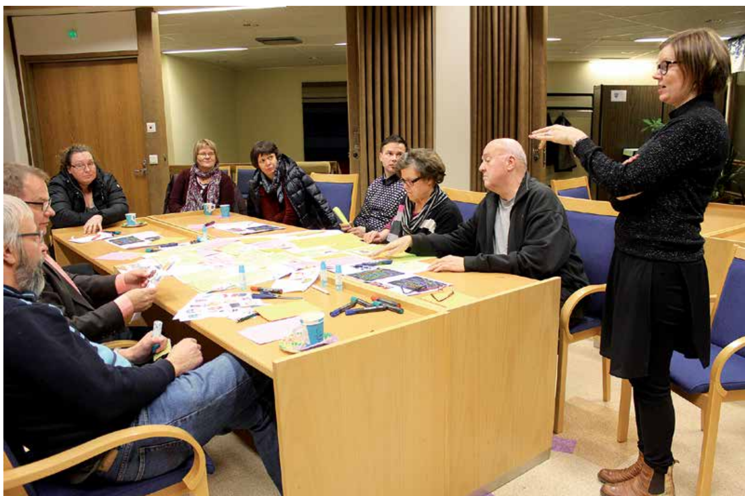
Lapin liiton työpajaan osallistuneet sallalaiset arvioivat, että kansainvälistyminen jatkuu, ja teknologia tuo mukanaan elämää helpottavia keksintöjä.

Kunnan kumppaneita hyvinvoinnin edistämisessä ovat vapaaehtoiset, yhteisöt, järjestöt,