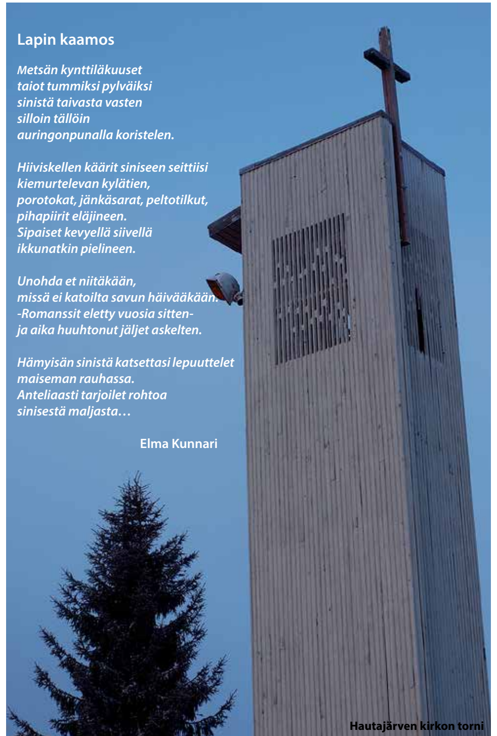
Hautajärven kirkon torni

Hyvää joulua ja onnellista uutta vuotta!