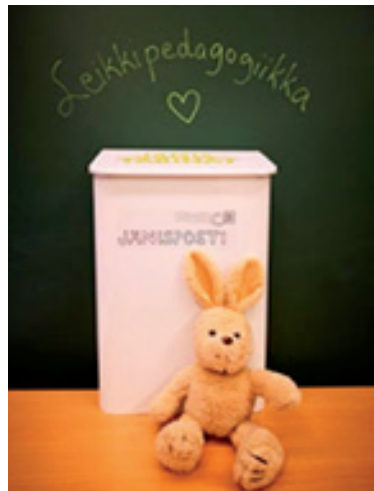
Lapsi oppii leikin kautta. Sallan kunnan esiopetuksessa panostetaan leikkipedagogiikkaan ja ohjattuun leikkiin.

opetuksen alussa lapsen yksilöllinen oppimissuunnitelma yhteistyössä lapsen ja huoltajien kanssa. Oppimissuunnitelmassa sovitaan mm. lapsen esiopetuksen järjestämisestä lapsen tarpeista ja lähtökohdista käsin, oppimisen tavoitteista, toimenpiteistä ja menetelmistä sekä tehtävästä yhteistyöstä huoltajien kanssa.