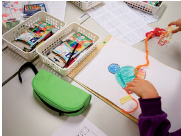
Eskarissa opitaan kädentaitoja.

Yleinen tuki kuuluu jokaiselle esiopetusikäiselle lapselle. Yleinen tuki pitää sisällään kaikki sellaiset toimintatavat ja käytännöt, jotka tukevat kaikkia ryhmän lapsia. Yleisen tuen perustana on laadukas varhaiskasvatus ja esiopetus, joka on lasten tarpeista käsin suunniteltua, esiopetuksen opetus-suunnitelman perusteisiin pohjautuvaa toimintaa. Yleinen tuki on ensimmäinen keino vastata lapsen tuen tarpeeseen. Tämä tarkoittaa yleensä yksittäisiä tukitoimia, joilla tilanteeseen vaikutetaan mahdollisimman varhaisessa vaiheessa. Yleistä tukea annetaan heti tuen tarpeen ilmetessä, eikä tuen aloittaminen edellytä erityisiä tutkimuksia tai päätöksiä.