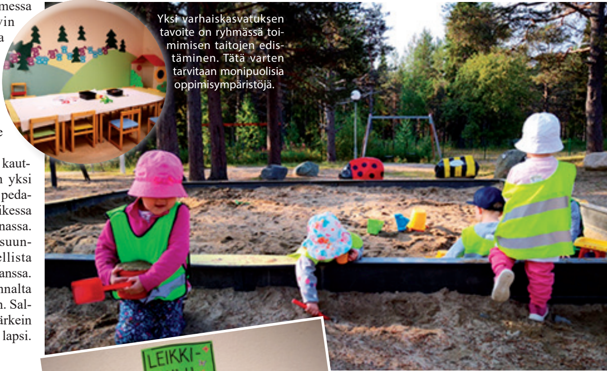
Lapsen leikki on tärkeä osa vakan arkea.

Yksi varhaiskasvatuksen tavoite on ryhmässä toimimisen taitojen edistäminen. Tätä varten tarvitaan monipuolisia oppimisympäristöjä.