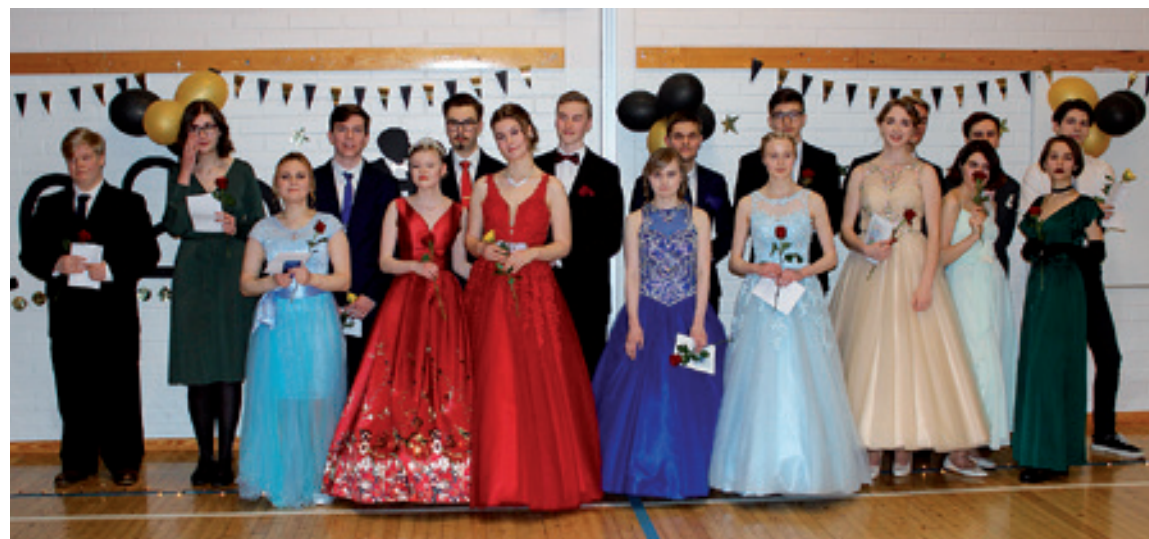
Sallan lukion vuoden 2020 vanhat tanssiaispäivän iltajuhlan päätteeksi yhteiskuvassa.