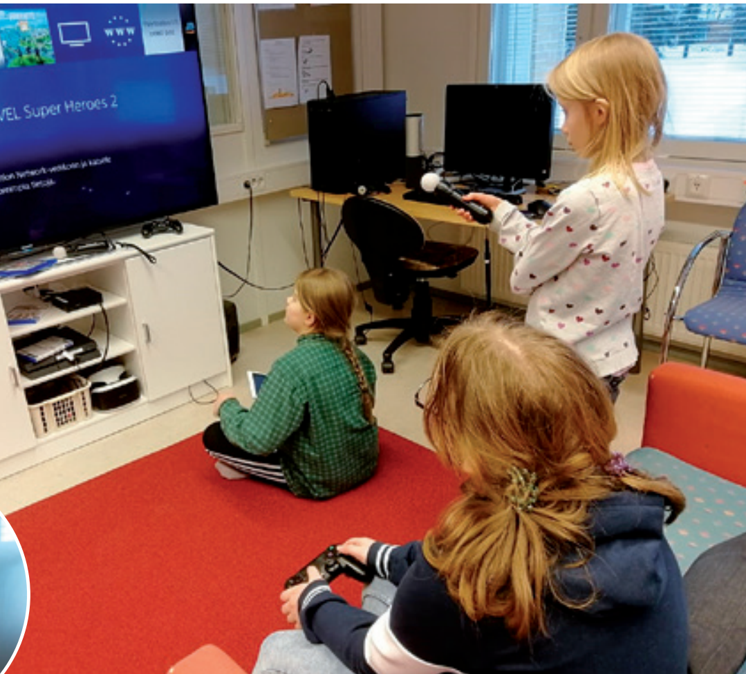
Sallan kirjaston mediatilassa on mm. 10 kpl Ipad laitteita, PS 4 pelikonsoli, pöytäpelikone ja pelinäp-päimistö, 75 tuuman näyttö, virtuaalilasit, 8 lainattavaa Chromebookia, Wii-pelikonsoli, Biljardipöy-tä, ompelukone.