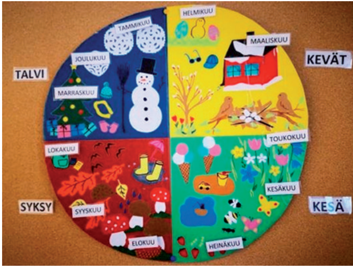
Esiopetuksen vuosisuunnitelmassa huomioidaan luonto ja luontopainotteisuus.

Esiopetuksessa käytetään varhaiskasvatukseen soveltuvaa pedagogiikkaa ja kunnioitetaan lasten mielenkiinnon kohteita opetuksen järjestämisessä. Opetuksen järjestämisen peruslähdekohta on leikki. Leikki huomioidaan toiminnan suunnittelussa ja toteuttamisessa, ohjauksessa sekä lapsen vapaassa toiminnassa. Lapsi oppii leikin kautta, leikki on lapsen tapa elää sekä hahmottaa maailmaa. Sallan kunnan esiopetuksessa panostetaan leik-