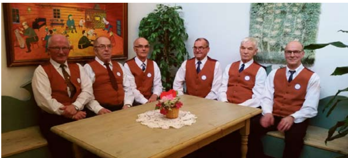
Savinapojat Hautajärvelä toivat tuulahduksen ikivihreitä Hopeaharjuun Vanhusten viikolla.