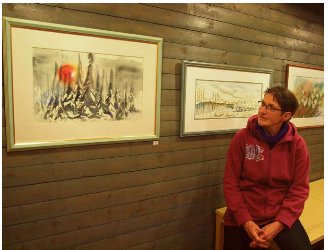
Seuraava taide näyttely Rauni Päiväniemellä on suunnitelmassa ensi kesänä.