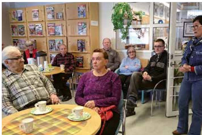
Yhteistyössä Lapin Kansan, Veikon Koneen ja Sallan OP:n kanssa toteutettu Tablet-kurssi, jossa opetettiin tablet-laitteen käyttöä kolmessa eri ryhmässä. Kuva kurssien päätöstilaisuudesta.

Kirjastoauton lainat olivat 18 697 kappaletta. Auton lainausmäärät kaikista lainauksista on yli 30 prosenttia mikä kertoo siitä, että palvelu on tärkeä sivukyläen asukkaille ja että pal-