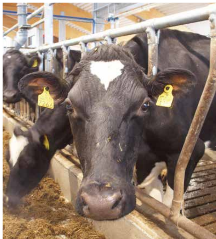
Tapioiden lehmillä on nimet. Kuluvana vuonna syntyvät vasikat alkavat kaikki N-kirjaimella.

” Automaation avulla lypsävien määrä on mahdollista nostaa 160:een.