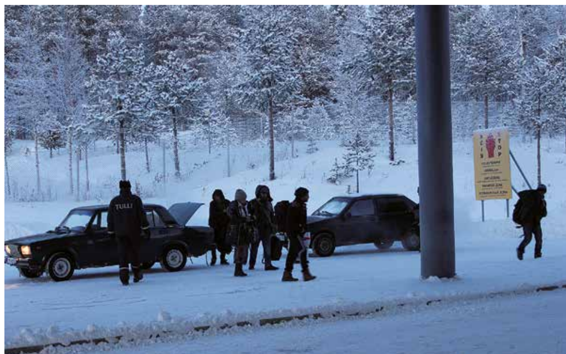
Sallan Raja-aseman kautta tuli tammi-helmikuussa Suomeen pari-kolme autollista turvapaikanhakijaa päivässä. Tilanne rauhoittui helmikuun lopulla.

Sallan raja-aseman kautta on tullut Suomeen alkuvuoden aikana yhteensä 858 turvapaikanhakijaa. He edustavat 29 eri kansallisuutta. Heidä tuli maahan helmikuun loppupuolelle asti keskimäärin noin 15 henkilöä päivässä, kunnes tulo loppui 28. helmikuuta.