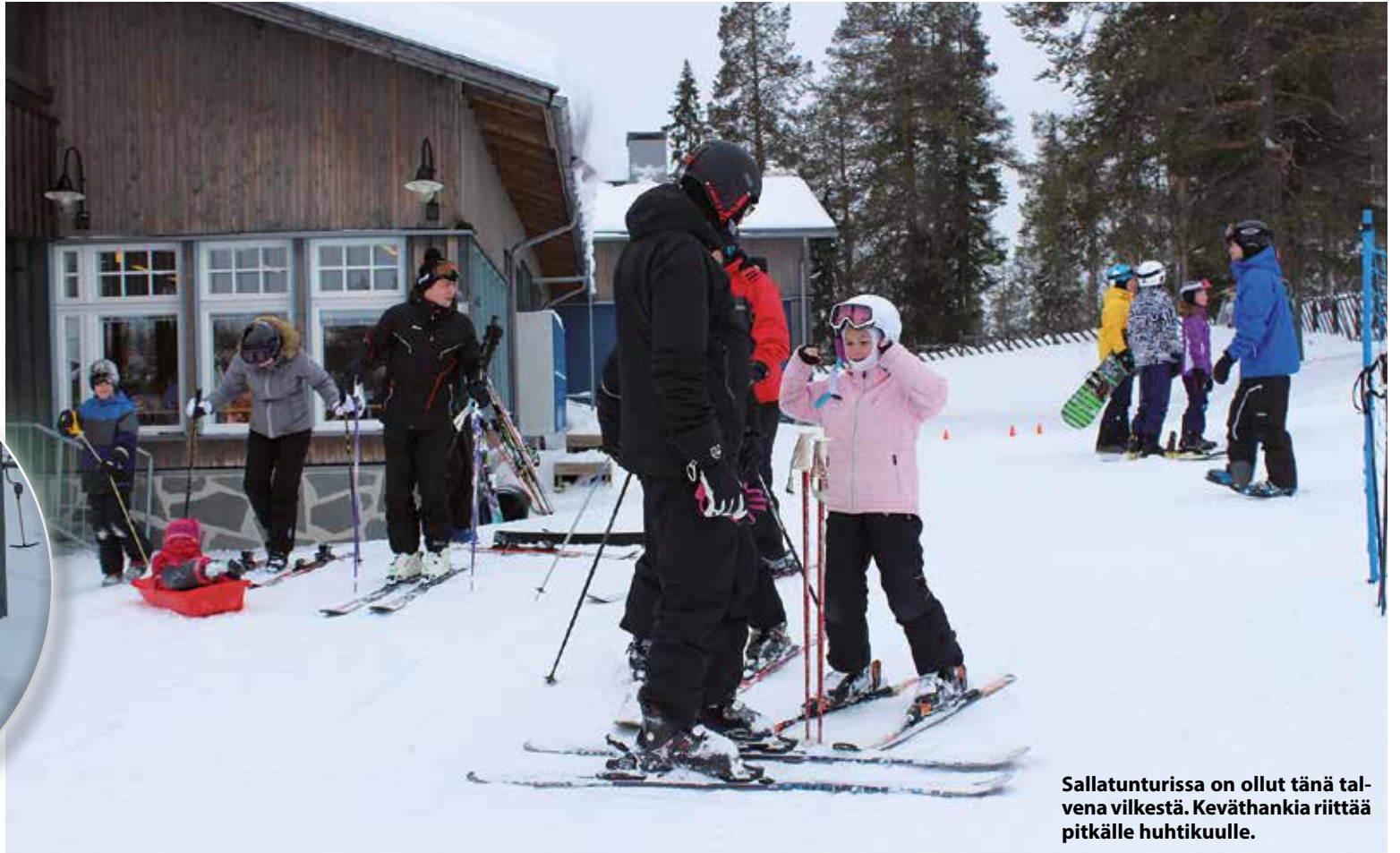
Sallatunturissa on ollut tänä talvena vilkestä. Keväthankia riittää pitkälle huhtikuulle.

” Luhtitaloihin tulee yhteensä 25–35 huoneistoa.