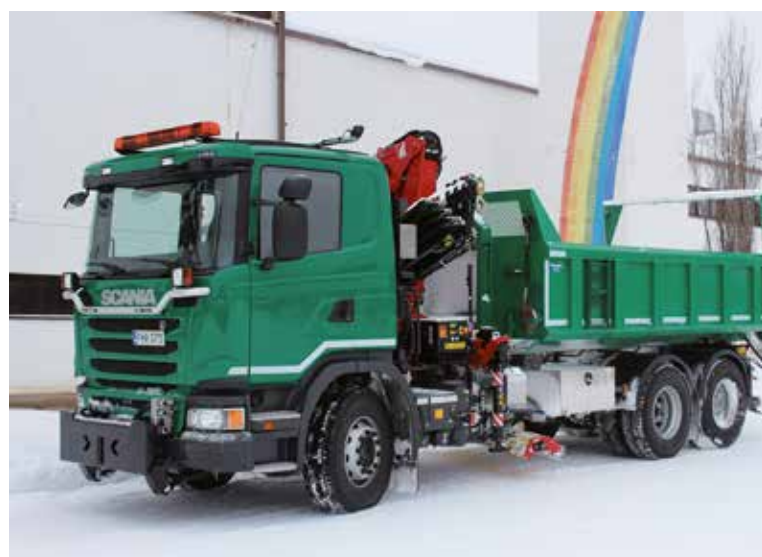
Scanian ensimmäisiä edustusajaja oli Sallan lukion abiturienttien penkkariajo helmikuussa.

Isolla nosturilla voi nostaa painaviakin rakennustarvikkeita. Autossa on kourat myös pieni-