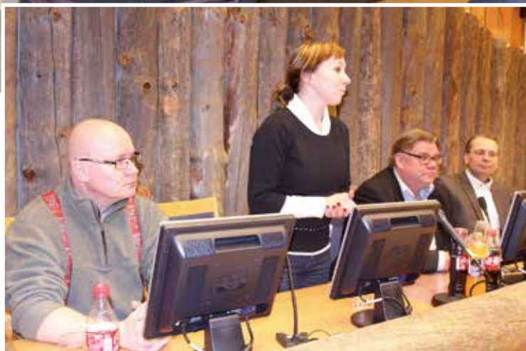
Oikeus- ja työministeri Jari Lindström, sosiaali- ja terveysministeri Hanna Mäntylä, ulkoministeri Timo Soini ja puolustusministeri Jussi Niinistö kävivät kuuntelemassa sallalaisten kuulumisia.

Perussuomalaiset ministerit vierailivat Sallassa tammikuussa Lapin-kierroksellaan. Vierailu oli siitä erikoinen, että Sallassa ei tietyvästi ole koskaan aiemmin käynyt neljää ministeriä yhtä aikaa.