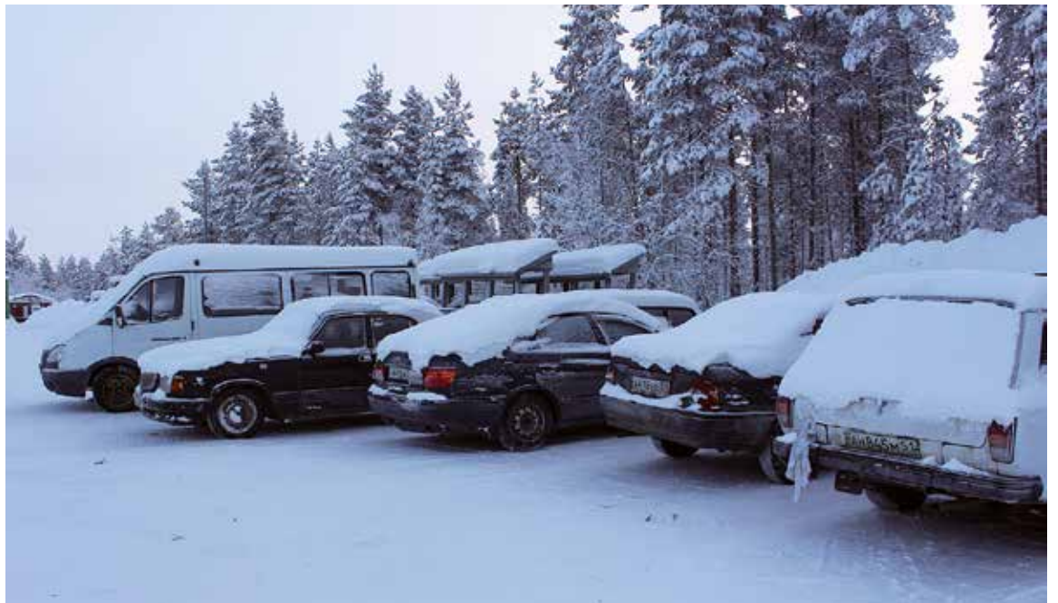
Osassa autoja on kesärenkaat ja osa on Suomen säännösten mukaan ajokelvottomia.