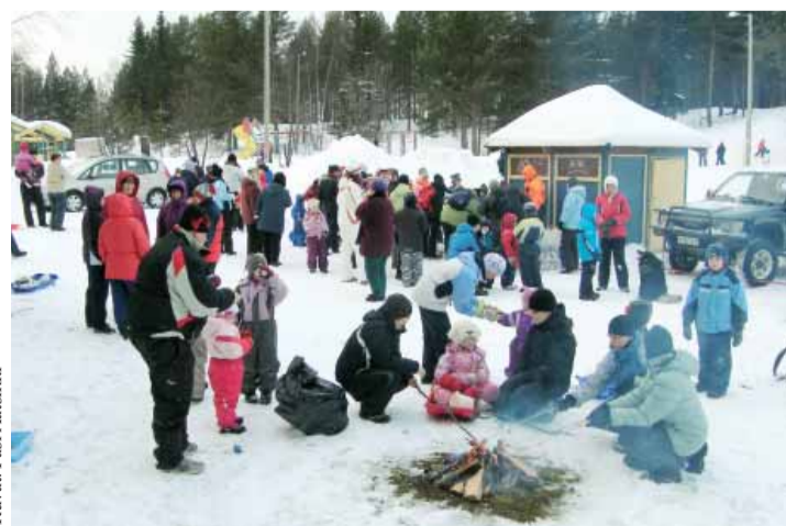
Sallan Vesaiset osallistui perinteiseen laskiaisriehan järjestämiseen.