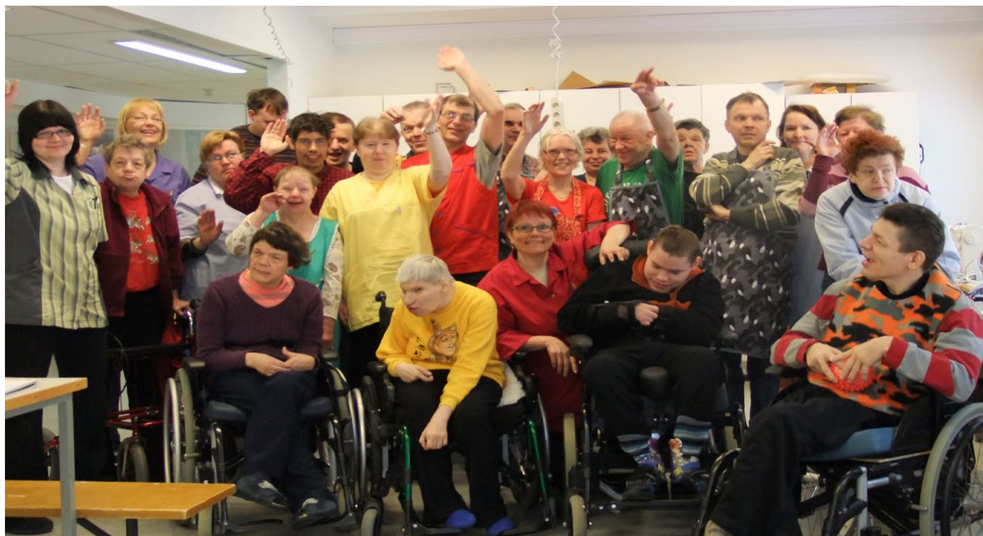
Toimintakeskuksen iloista työväkeä