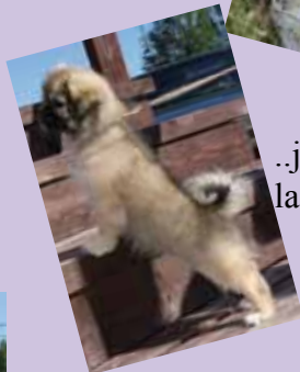
..ja ensikertalainen Muru.