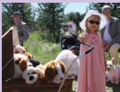
Suuriakin koiralaumoja nähtiin, mutta onneksi nämä koirat pysyivät nätisti vaunuissa.