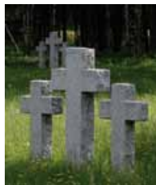
Vanhan Sallan Jumalanpalvelusmatka 18.7.2010. Juhlissa oli satakunta osallistujaa.

Yhtenä tärkeimmästä seuran tavoitteesta on ollut tarjota kaikille halukkaille mahdollisuus päästä käymään entisillä asuinsijoillaan.