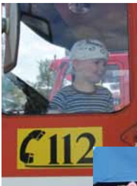
Lapsille oli tarjolla monenlaisia elämyksiä ja