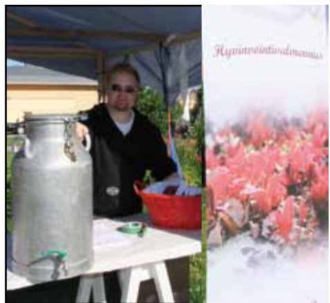
Saimme hyvinvointia tonkasta..