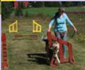
..ja vaarallisia tilanteita koirien esteratakilpailussa.