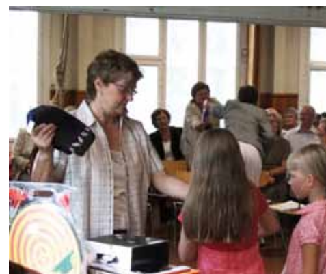
Tilaisuuden lopuksi tytöt saivat toimia onnettarina arvonnoissa.