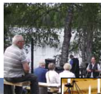
”Amfiteatteri” järven rannalla