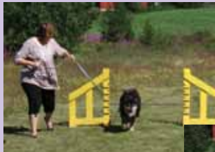
Koiramarkkinoilla nähtiin vauhtia....