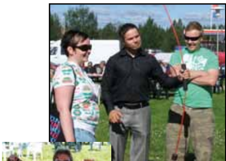
ja Sallapäivillä pääsimme tutustumaan uusiin liikuntalaitteisiin.