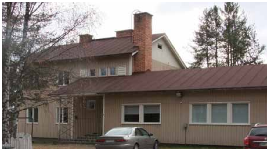
Neuvolat löydät Kinttalanpolku 3:sta (kuva talosta yläpuolella)