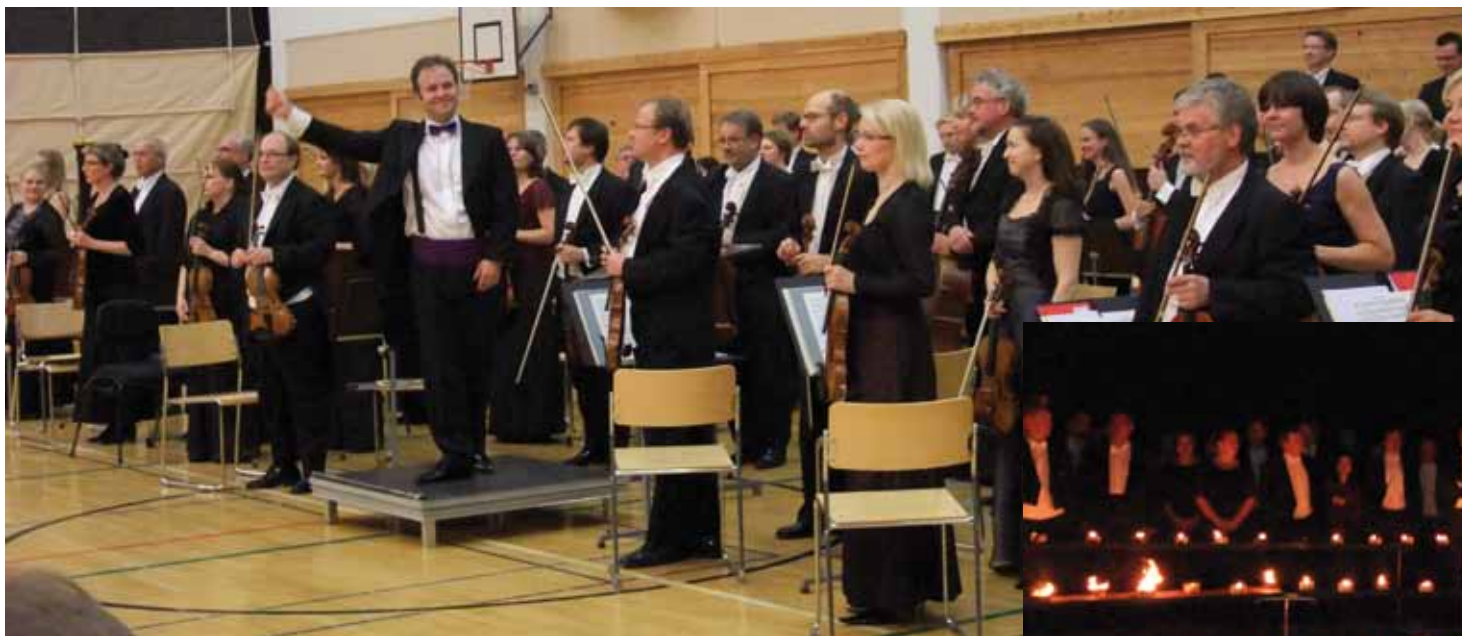
Viereinen kuva: kapellimestari Sakari Oramo ja Radion sinfoniaorkesteri. Alakuvassa sinfoniaorkesterin jäsenet yhteiskuvassa kemijärveläisten ”maatulien” äärellä.