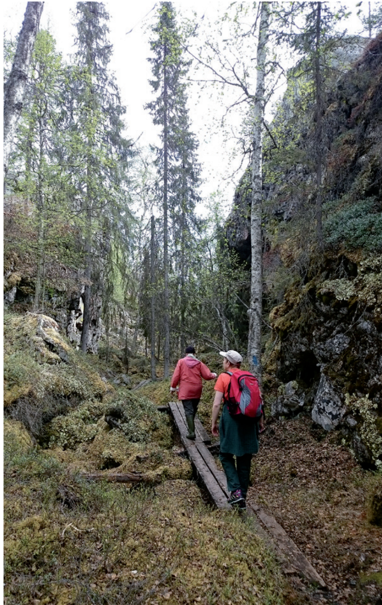
Hirvasvaara - hiidenkirnujen reitillä.

Sallassa aloitetaan tärkeimpien retkeilyreittien kuntokartoitus