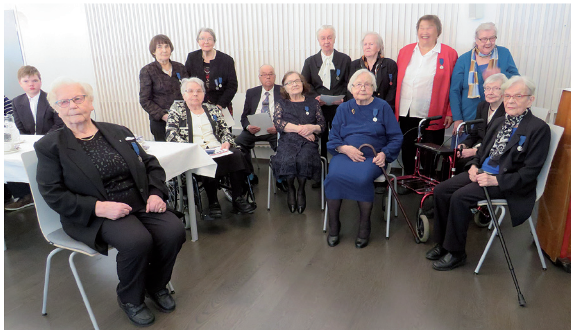
Sallalaisia mitalin saajia juhlassa seurakuntatalolla 28.4.2019.