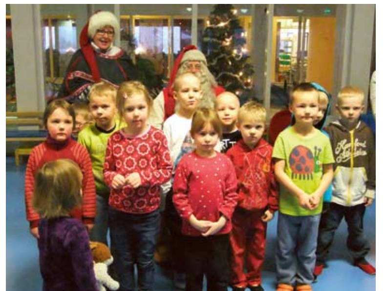
Kilttejä lapsia Joulupukin ja Muorin kanssa Tennontien päiväkodilla.

Iltapäivästä Joulupukki hyvästeli Muorin ja palasi takaisin Korvatunturille Tonttulaan valmistelemaan jouluaaton suurta matkaansa.