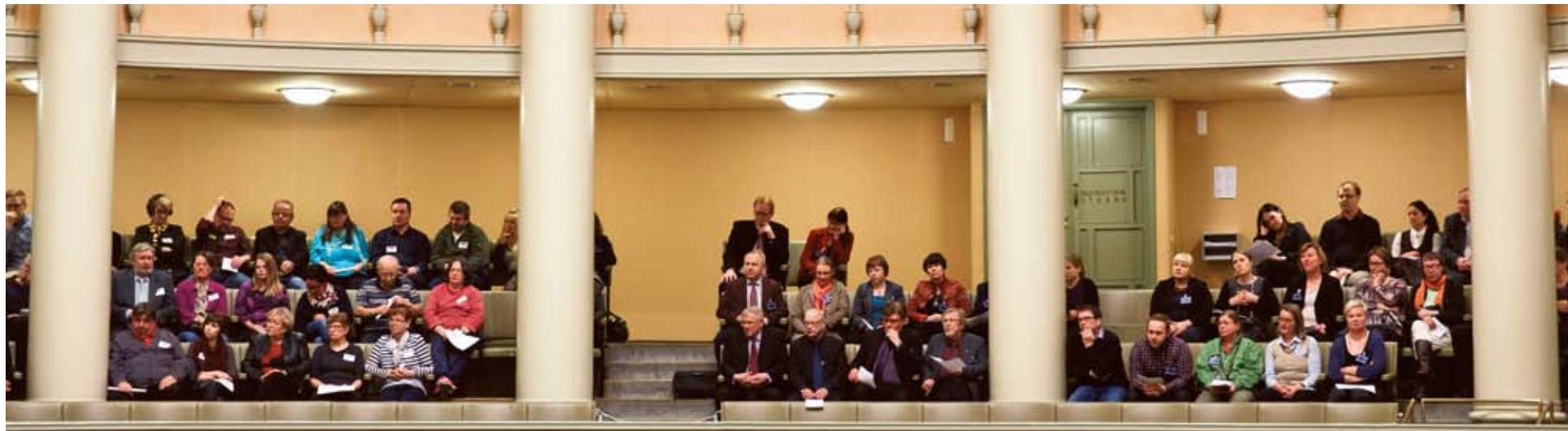
Vierailunsa aikana sivistyslautakunnalla ja kunnan viranhaltijoilla oli mahdollisuus seurata eduskunnan kyselytuntia sekä äänestystä tasa-arvoisesta avioliittolaista.