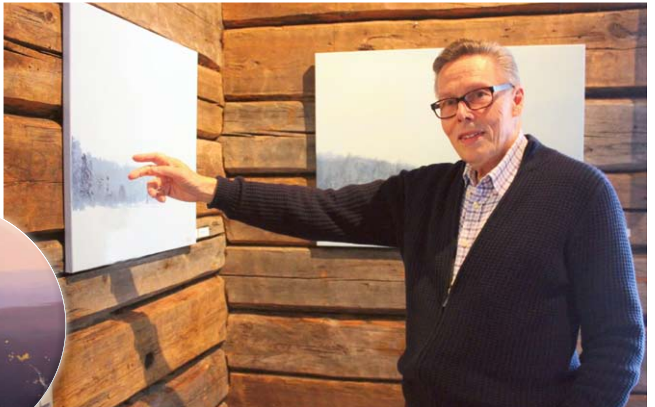
Salla-aiheiset maalaukset houkuttelivat kävijöitä Rajakievariin syyskuussa.