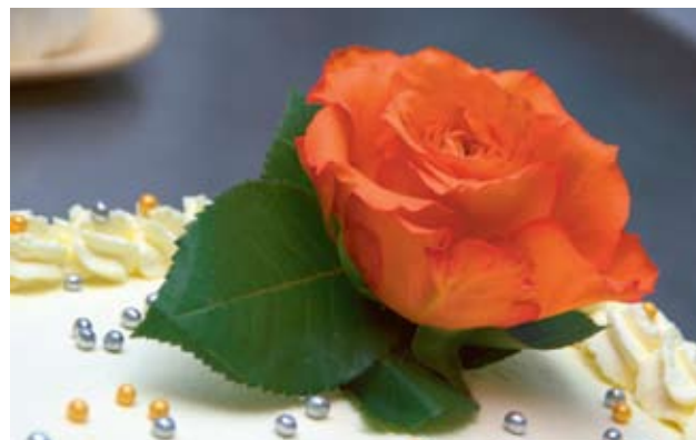
Aprillipäivänä museolla vietetään 5-vuotissynttäreitä kakukahvien merkeissä.

Talvisodan muistohiihto hiihdetään jälleen maaliskuun viimeisenä viikonloppuna Kemijärveltä Sallaan. Viiden vuoden välein järjestettävään muistohiihtoon liittyen Sallan sota- ja jälleenrakennusajan museo järjestää sotien päättymiseen ja jälleenrakennusajan liittyvän seminaarin ”Savusta sikisi Salla”.