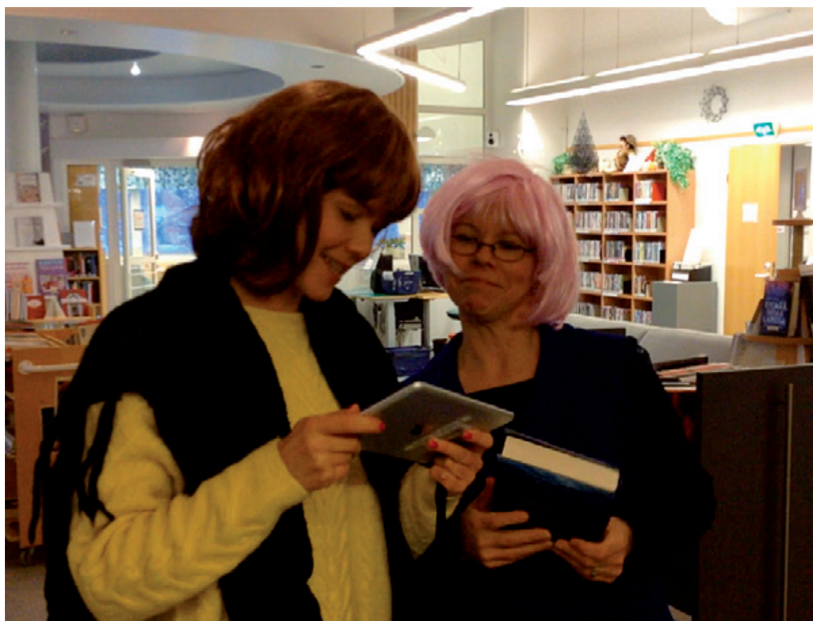
Kumpi sinä olet kirjaston käyttäjänä: Irma vai Raija?