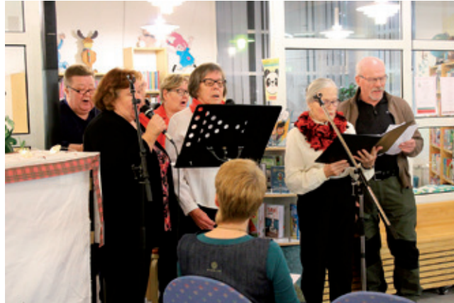
Salmivaaran kuoro kansalaisopiston juhlassa.

” Vapaaseen sivistystyöhön investoidut eurot maksavat itsensä takaisin vähintään kolminkertaisena.