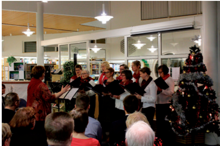
Kansalaisopiston juhlassa esiintyi mm. naiskuoro Sallattaret.

Yleisimmin kunnallisina oppilaitoksina työväenopistot korostivat poliittista, yhteiskunnallista ja uskonnollista sitoutumattomuutta. Yhteys työväenliikkeeseen oli kuitenkin läheinen – useat opistoitan oli perustettukin työväenyhdistyksen aloitteesta. Ensimmäinen muulla kuin työväenopiston