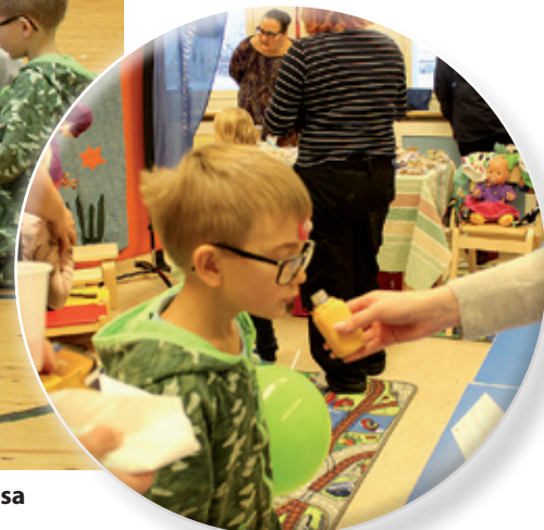
Museo esitteli vanhoja esineitä ja arvuutteli perinteisiä tuoksujä. Kuvassa olevasta pullosta paljastui karde-mumman tuoksu.

” Vaka pop up - Perheiden päivän tavoitteena oli tehdä ”enemmän yhdessä”.