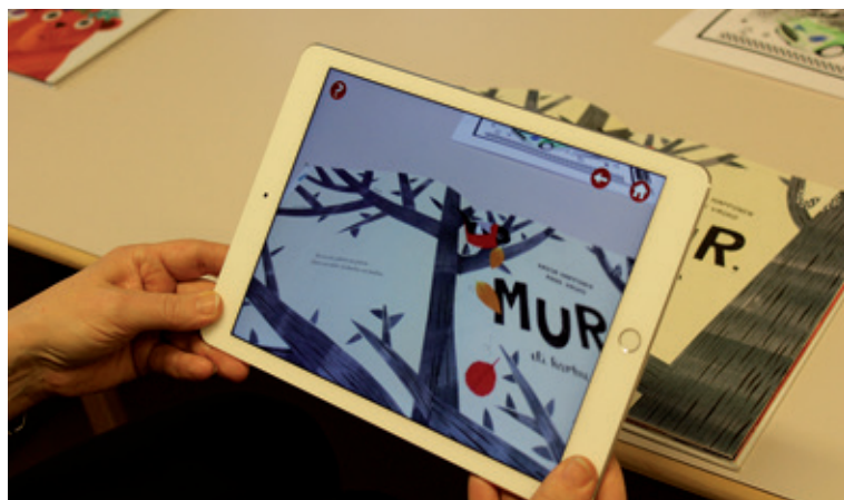
Kirjaston väki ohjasi lapset ja aikuiset ihmeelliseen 3D-digimaailmaan

Ulkona VPK esitteli hälytysajoneuvojaan ja Sallan Latu ja Polku järjesti makkarapaistopisteen. Sisätiloissa olivat