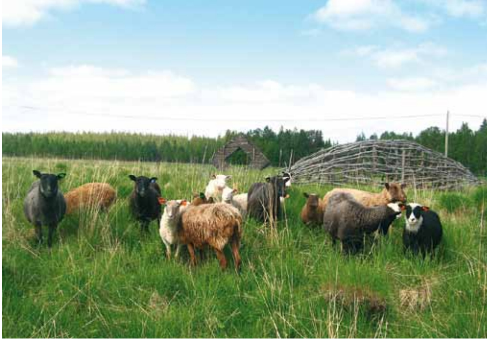
Lampaat hoitavat maisemaa Kellošelässä.

Muistatko, millainen oli lapsuutesi kotikylän maisema? Vuosikymmeniä sitten maatalous piti kylämaisemat elävinä ja avoimina. Maatalouden vähennyttyä on pitänyt keksiä muita keinoja, ja niitä on Sallassa etsitty ja käytetty jo vuosien ajan niin omaehtoisesti kuin hankkeiden kautta.