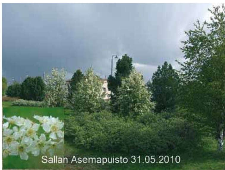
Sallan Asemapuisto 31.05.2010