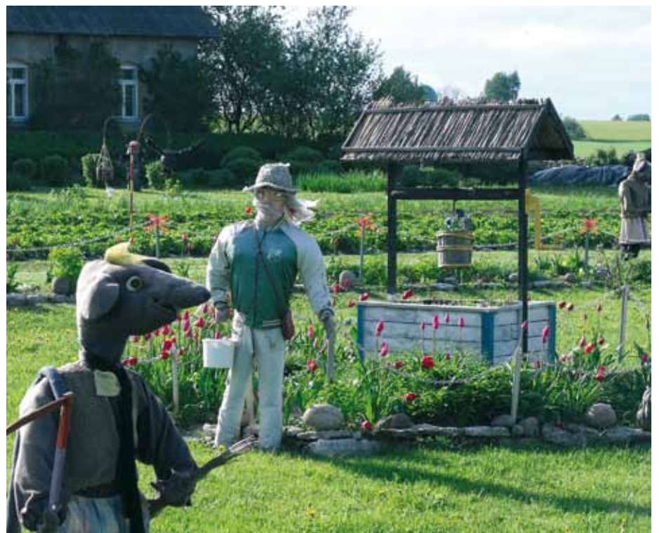
Kierrätysmateriaalista tehtyä puutarhataidetta kotipihaan.

Pyöräilyä Virossa voi harrastaa helppokulkuisilla kylä- ja maanteillä, joskin omatoimisilla retkillä mukana on oltava hyvä kartta. Ryhmämme testasi 16 km:n pätkän suunnitteilla olevaa pyöräreittiä. Pyöräily on rauhallinen ja kiireetön tapa tutustua Viron maaseudun kyliin ja matkailukohteisiin.(sa)