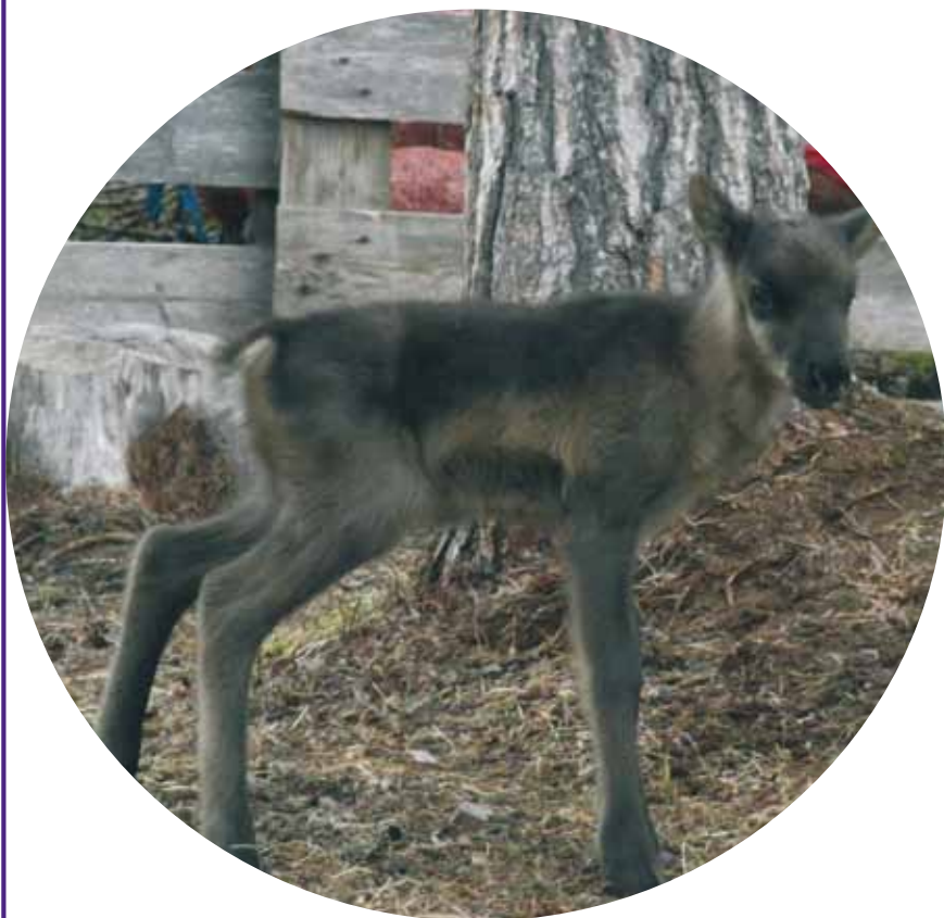
”Vappuna vasa hangella”

Poron vasat syntyvät toukokuun aikana. Vasan leikko aloitetaan juhannukselta, jolloin vasat saavat korviinsa omistajansa merkin.