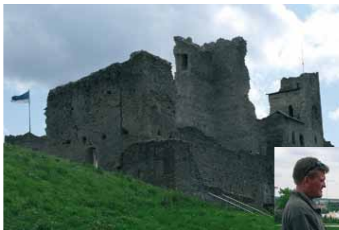
Rakveren linnoitus rakennettiin 1200–1400 luvuilla. Käynti linnoituksessa oli kiehtova kokemus pohjoisen matkaille.

Matkan Viron Sallaan järjesti PLL:N hallinnoima Sallasta Sallaan -hanke, jota rahoitetaan EU:n maaseuturahastosta.