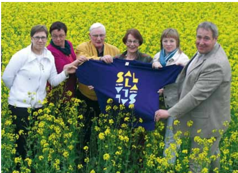
Sallasta Sallaan -hankkeen yhteistyökumppaneita terveen elämän lähteillä

Matkan Viron Sallaan järjesti PLL:N hallinnoima Sallasta Sallaan -hanke, jota rahoitetaan EU:n maaseuturahastosta.