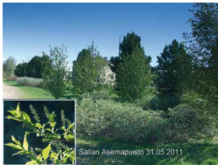
Sallan Asemapuisto 31.05.2011