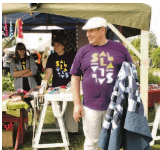
Vieraita Viron Sallasta