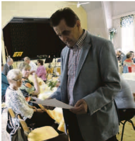
Karhujärven kyläpäivän kuului musiikkia, muotinäytös ja tarinointia. Vieraita kestittiin hyvällä ruoalla ja juomalla.