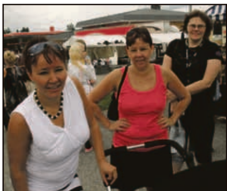
Vanhoja tuttuja vuosien takaa...