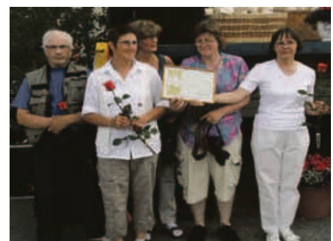
Sallan Taideseura sai Sallan kulttuuripalkinnon Sallapäivillä.

Hän toivoo, että taideseuralle löytyisi kunnan tiloista paikka, jossa taiteentekijät voisivat käydä maalaamassa milloin vain. Tila voisi olla samalla monien yhdistysten ja kansalaisjärjestöjen käytössä.