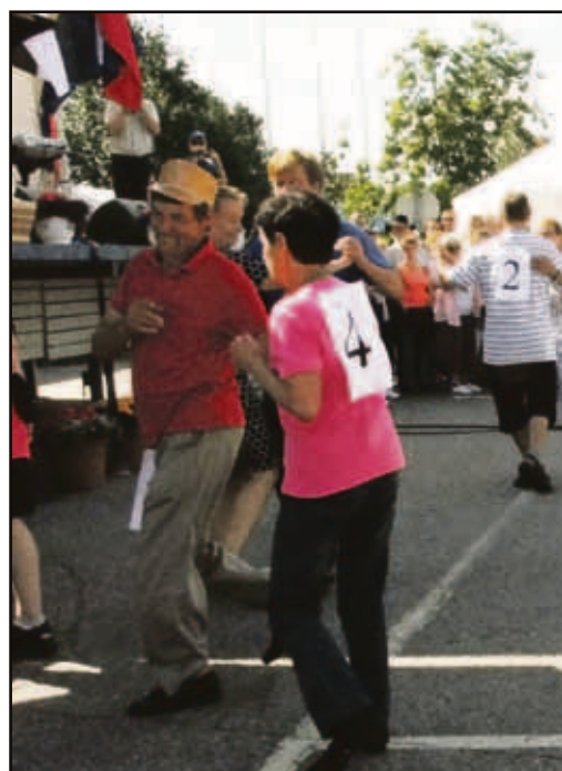
Leikkimielisen huppakilpailun voittajakaksikon taidonnäyte.