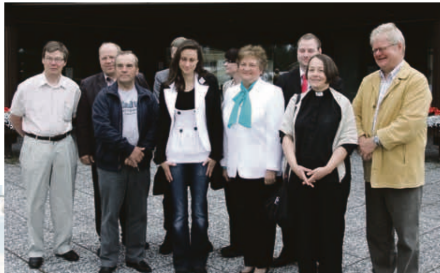
Sallan ystävyyskunta Wildaun vieraita Saksasta.