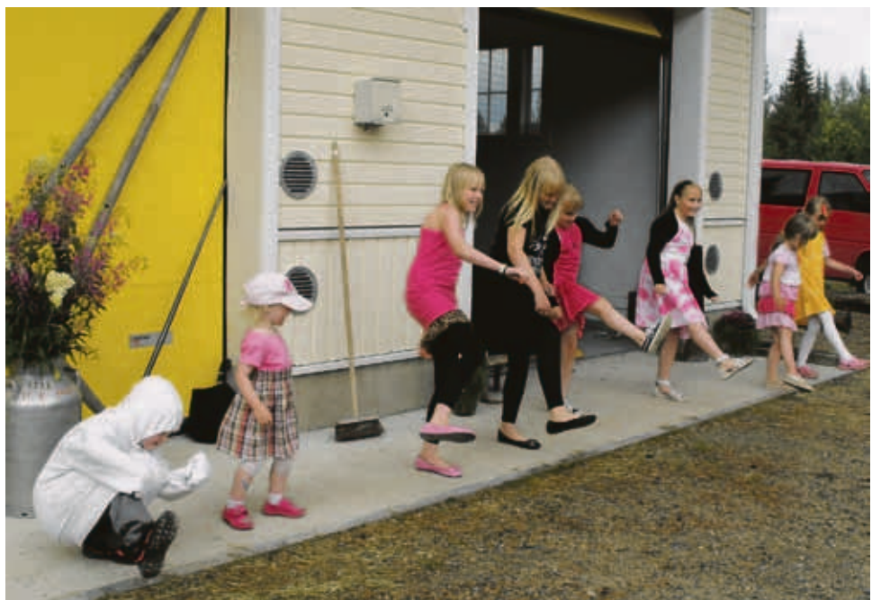
Kylän lapset tanssivat iloisen tanssin Fröbelin palikoiden tahtiin.