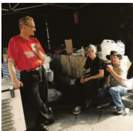
Myyjiä oli saapunut kauempaa...