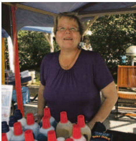
ja naapuripitäjästä Savukoskelta.