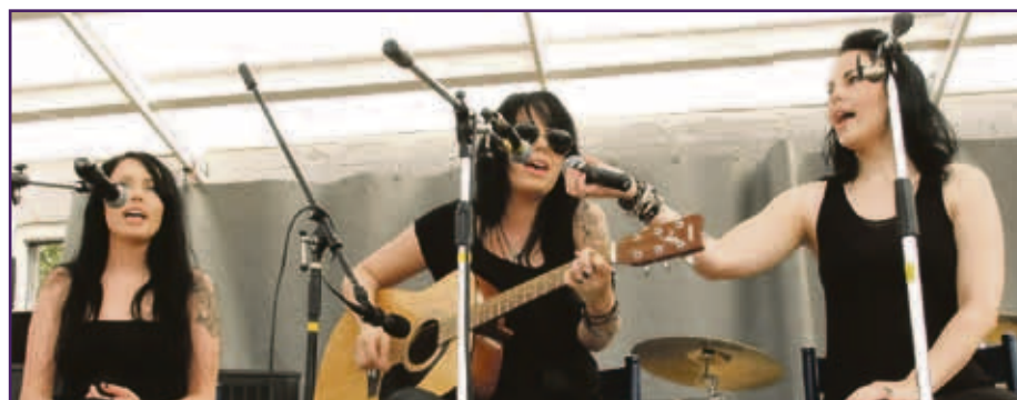
Stalingrad Cowgirls esiintyi