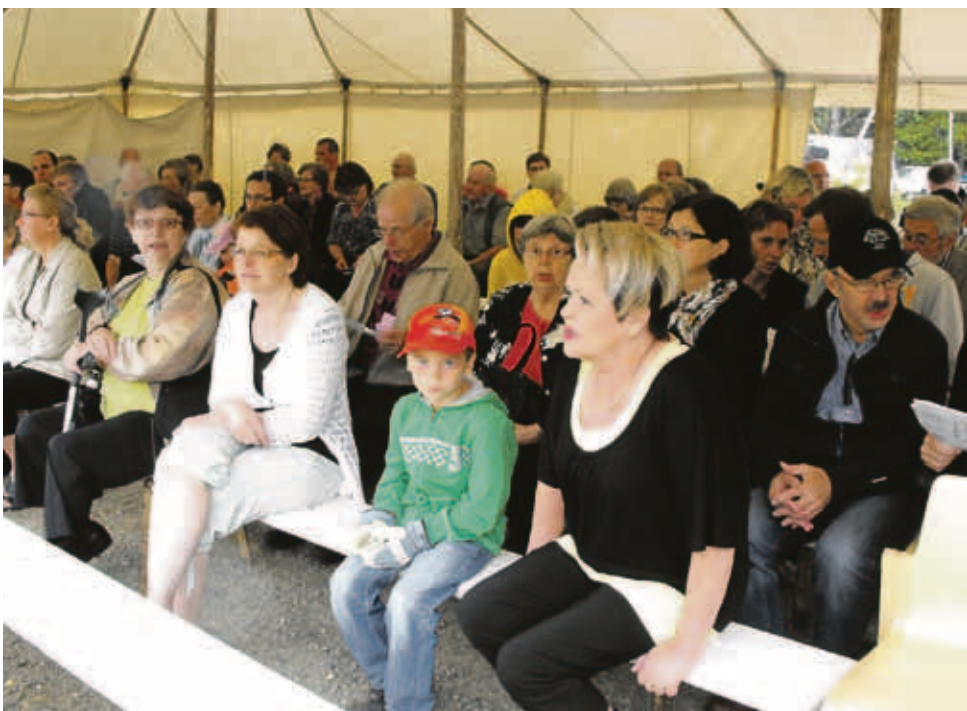
Yhteislaulu kuuluu kyläpäivään. ”Äiti lasta tuudittaa, lasta tuntureiden. Päivä taakse kaikkooa ylhäin tähtivöiden.”

Salmivaaran kyläpäivä kokosi yli sata henkeä kylän entiselle koululle, nykyisen Metlan pihapiiriin. Kyläpäivä järjestettiin nyt neljännen kerran, ja päivämäärä on aina ollut sama, 17.heinäkuuta.