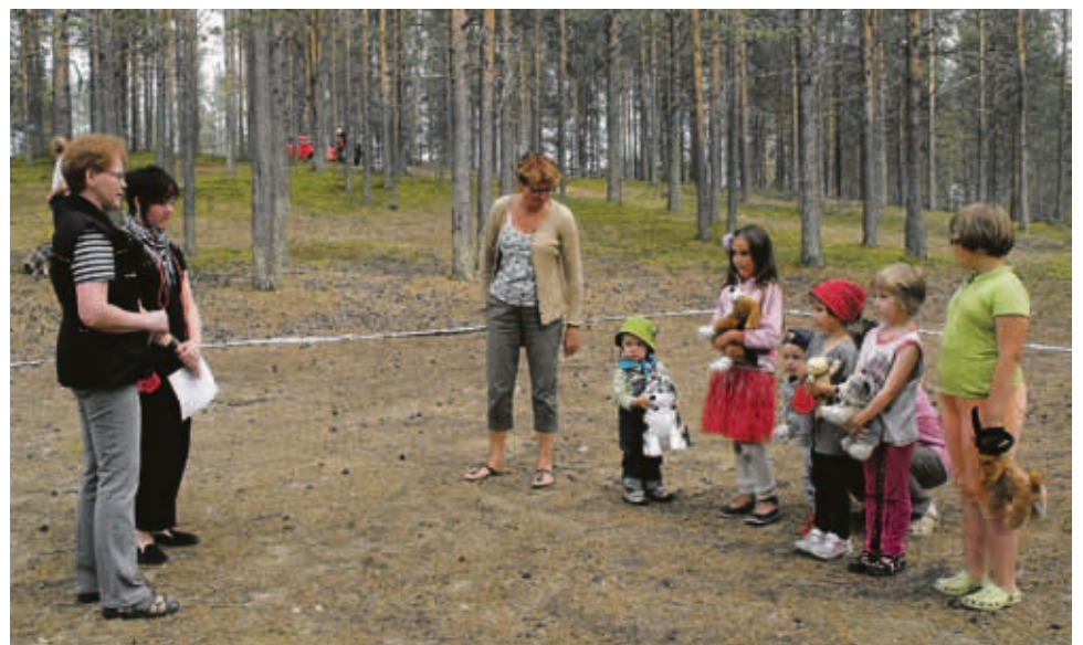
Lapsille oli oma pehmokoiranäyttely.