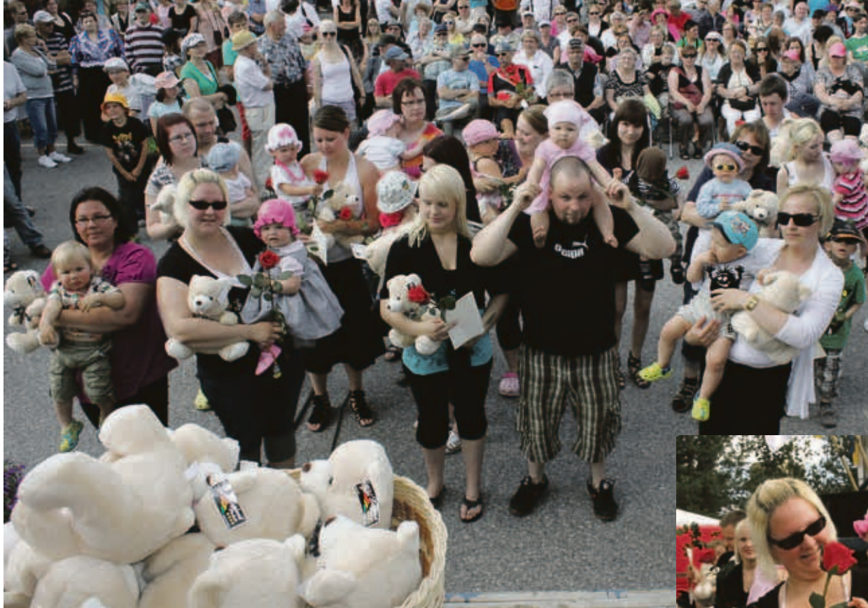
Osa Sallan kunnan kummilapsista vanhempineen.