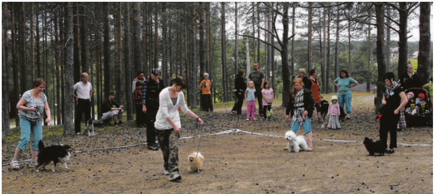
Match showssa oli runsaasti osanottajia.

Koiranäyttely pidettiin Saija-pirtillä, ja samaan aikaan Kaunisharjun maastossa