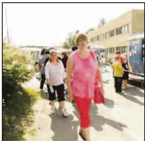
sekä tuttuja kasvoja Sallasta.