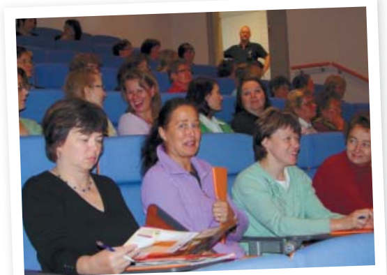
Tietotulvaa ja kiirettä pohtimassa pilke silmäkulmassa.