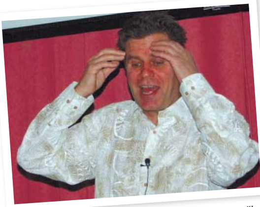
"Tietotulvan takia ihminen ei osaa pysähtyä ja se näkyy kärsimättömyytenä"