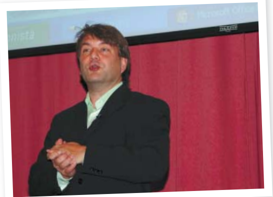
"Hyönteitä, terveyttä, kauneutta ja puhtautta etsiviä kuluttajia on liikkeellä."