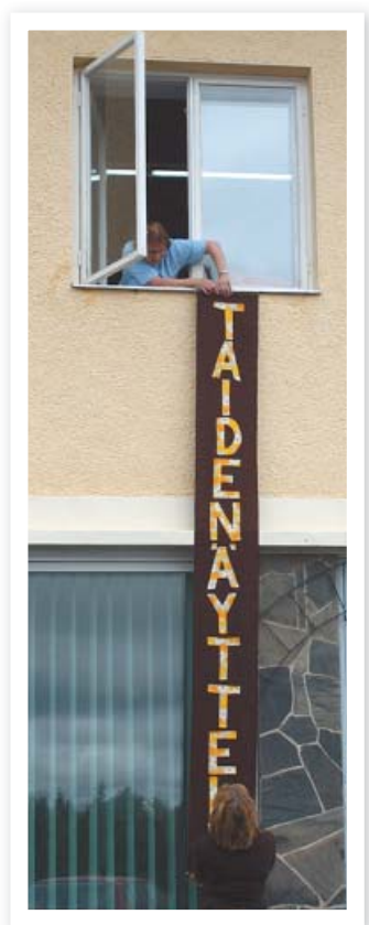
Näyttelyn pystytyksessä on muistettava monta asiaa, myös banderolli on asetettava paikalleen.

Sallan Taideseuran hallitus