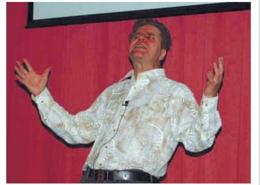
"Jokainen ihminen on luova. Roolin vetäminen haisee jo 10 km päähän."