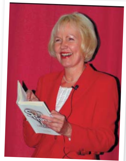
"Parisuhde on siten kaksiteräinen miekka: parhaimmillaan se tuottaa onnea, terveyttä ja hyvinvointia, pahimmillaan se kaventaa ihmisen mahdollisuutta toteuttaa itseään, saavuttaa tasapainoa läheisyyden ja erillisyyden välillä.