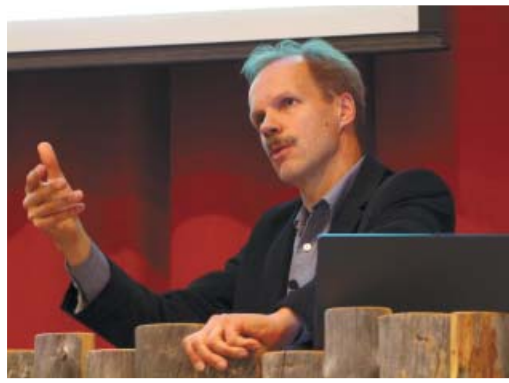
3 kivenhakkaajaa... Ensimmäinen vastaa kyllästytneen näköisenä hakkaavansa kiviä. Toinen hankkivansa elantoa perheelleen. Kolmas toteaa silmät loistaen: "Minä rakennan katedraalia." ...miten päästä tuohon kolmanteenkin, "katedraalin rakentamisfilosofiaan"