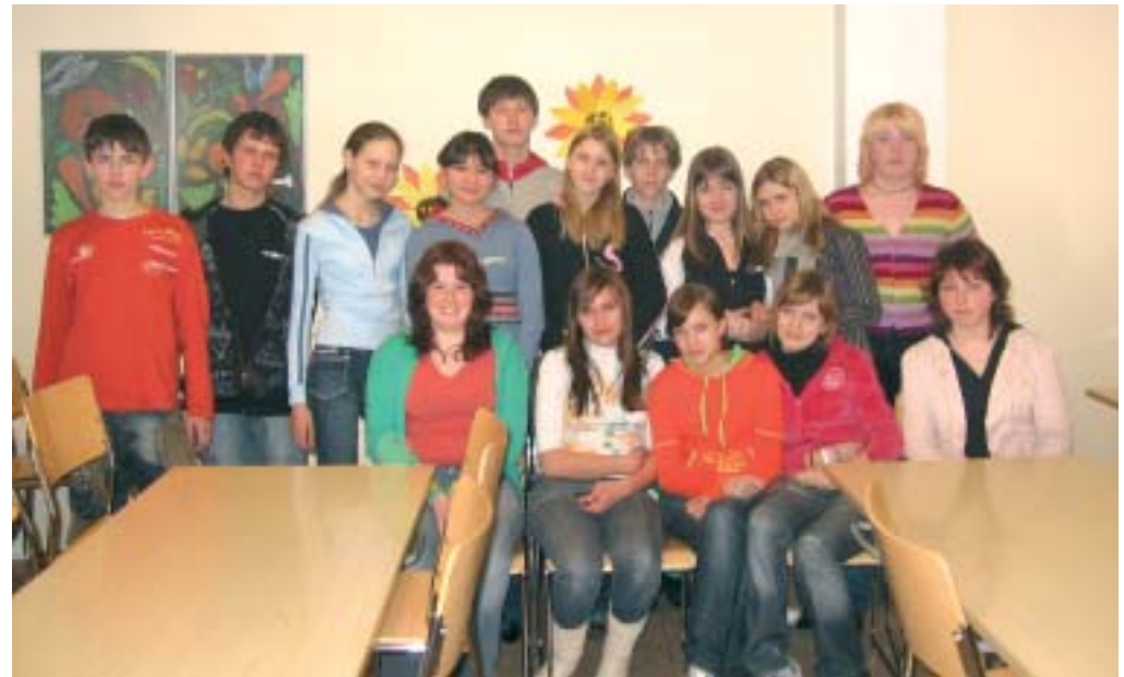
Polarnye Zorin kaupungin opiskelijoita.