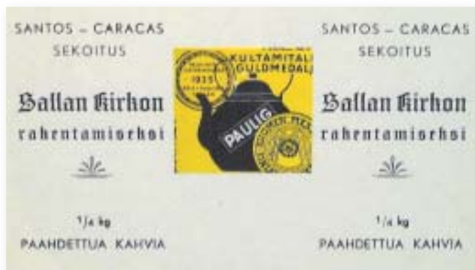
Jälleerakennusajan esineet ovat yksi museoesineiden keruun painopisteistä. Kuvassa on etiketti kahvipaketista, jota on myyty aikoinaan kun kerättiin varoja Sallan kirkon rakentamiseksi. Lieneekö kenenkään komerossa tai ullakolla tällaista pakkausta kootuna?

Hanke tekee kansainvälistä yhteistyötä Kantalahden alueen museoiden kanssa. Vielä tämän vuoden aikana järjestetään yhdessä rakennettu venäläis-suomalainen kiertonäyttely, joka tulee olemaan esillä sekä Sallassa että Kantalahdessa. Tavoitteena on, että yhteistyö jatkuisi tulevaisuudessa niin näyttelyiden, tapahtumien järjestämisen kuin tutkimuksenkin aloilla. Paikallismuseotasolla ei tällaista kansainvälistä yhteistyötä ole alueellamme aiemmin juurikaan tehty, nyt käynnistetty hanke on ensimmäinen.