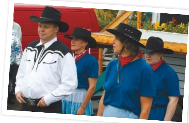
Sallalaiset "Kairan kantritanssijat" esittivät vauhdikkaita tansseja.