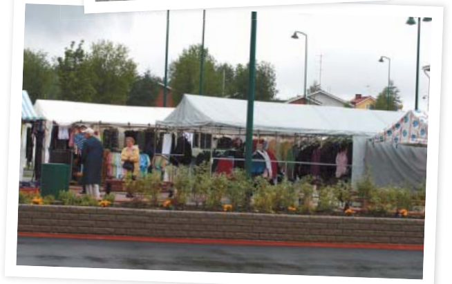
Sallan tori tai Jaanan tori, kuten sallalaiset sanovat, sai myös avauspuheet ja kasteet.