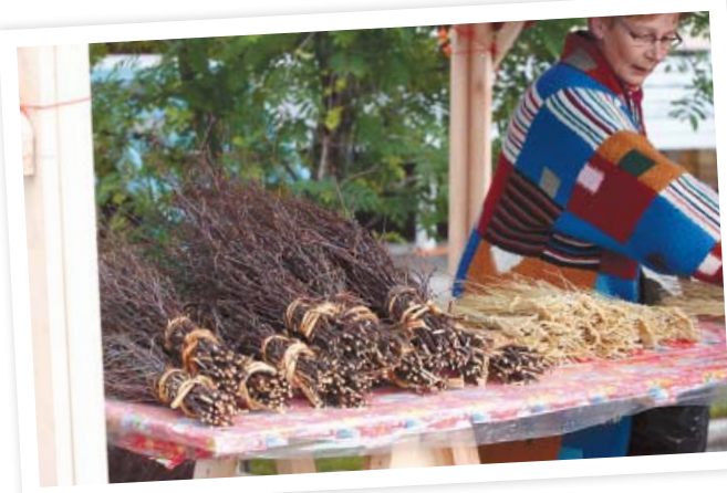
Kauppa kävi kuitenkin parkkipaikan katoksissa ja teltoissa. Siellä saivat kauppansa niin loimulohet kuin kuivalihavellitkin. Eri kojuissa olivat ahkerat sallalaiset myymässä tuotteitaan, kuka varpuluutia, kuka leivonnaisia.