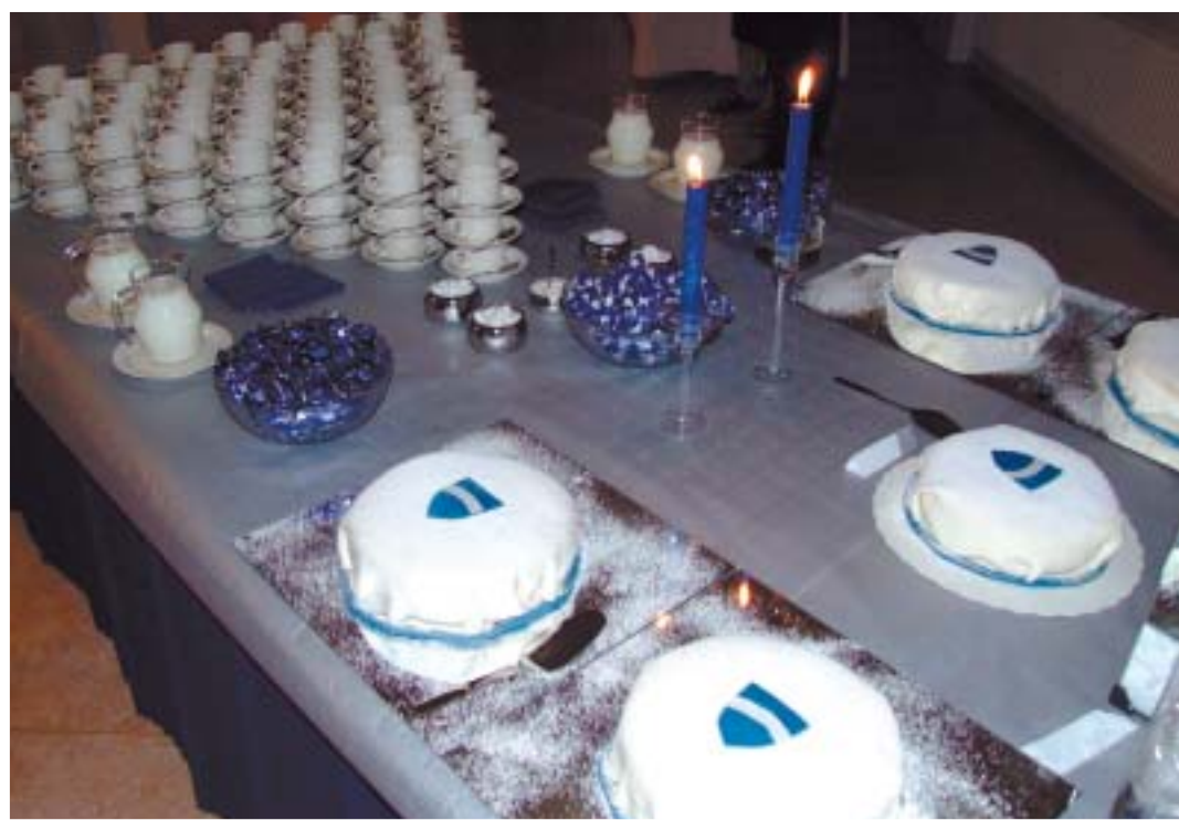
Jälkiruokapöydässä tarjolla Sallan nimikkokakkua.

Nina, Inkeri, Noora