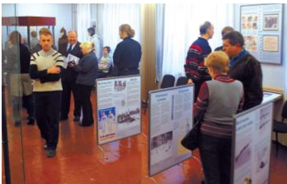
Kantalahdessa näyttely sai melko paljon kävijöitä. Avajaistilaisuudessaakin oli paljon kiinnostuneita.

Museoalankehittäminen Sallan ja Kantalahden alueilla – hanke on poikunut kansallisella tasolla ainutlaatuisen tuloksen suomalais-venäläisestä paikallismuseoyhteistyöstä. Sallan museo ja Kantalahden kaupunginmuseo ovat viime keväästä lähtien suunnitelleet yhteistä kiertonäyttelyä, joka olisi esillä sekä Venäjällä että Suomessa. Näyttelyn toteuttamiseen ovat osallistuneet myös Kantalahden kaupungissa toimiva 19. Armeijan museo sekä Alakurtin hallinto.