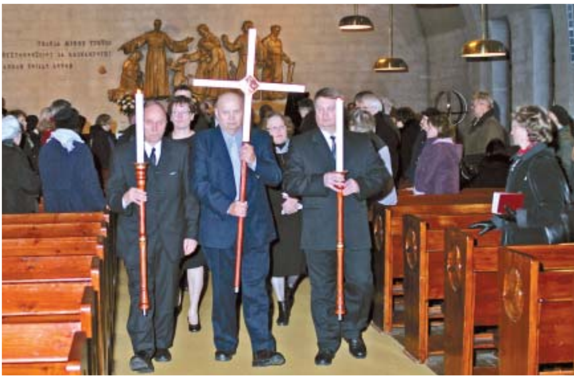
Juhlamestusta seurakuntatalolle siirryttiin ristisaatossa.