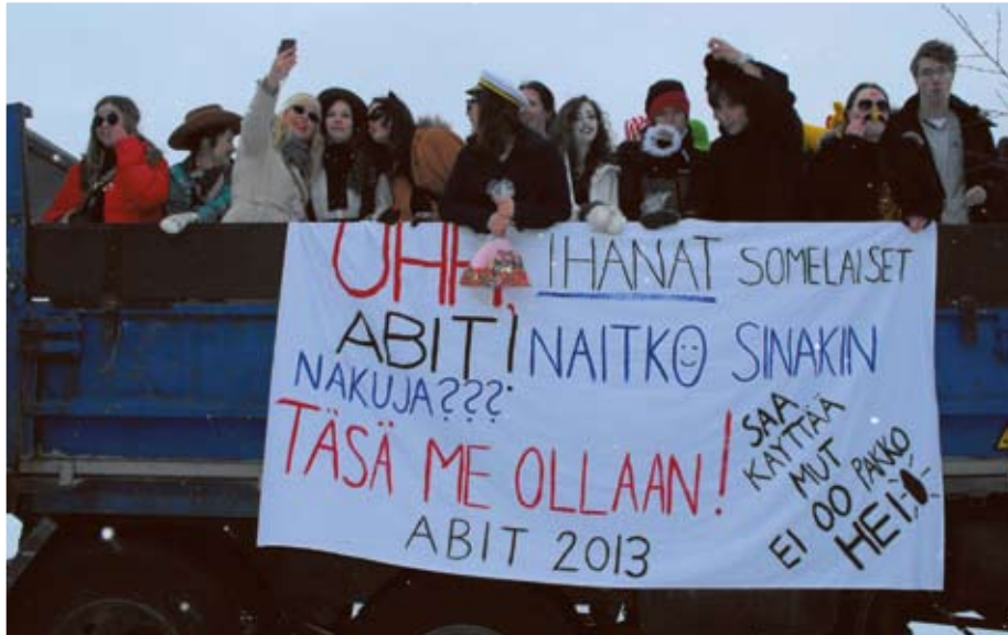
Koulu loppui, edessä lukuloma ja kirjoitukset. Abit ajelivat kylällä ja vierailivat perinteisesti alakoululla, päiväkodilla, kunnantalolla ja kaupoissa.