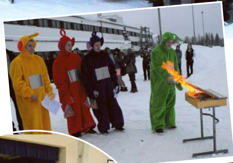
Pulpetinpoltto kuuluu penkkari-päivän perinteisiin.