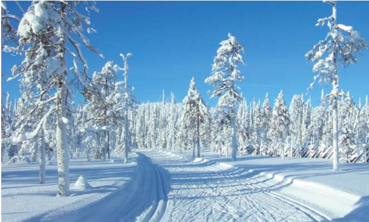
Ennätyslaskun maisemia Sallatunturin ympärysladulta.