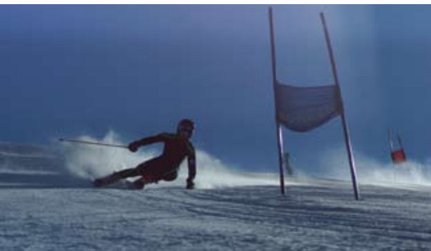
Santeri Virkkula. Audi-cup sarjassa M15 muutamia palkintosijoja ja kokonaispisteissä 7. Joitakin hyviä sijoja fiskaalipilauksissa sekä ulkomailla että Suomessa.