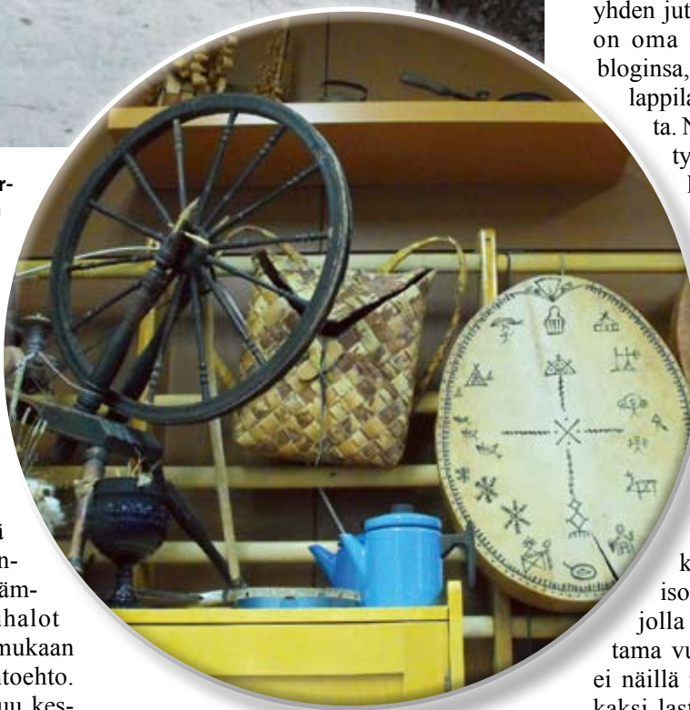
Vanhan ajan henki näkyy kauniisti entisen koulun sisustuksessa.