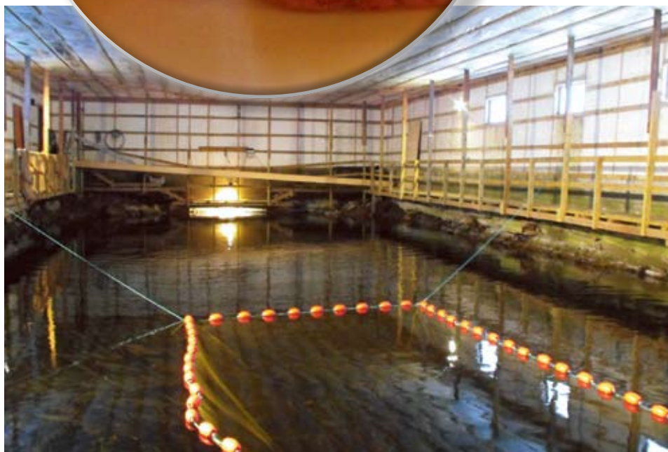
Nostohallin läpi virtaava Naruskajoen vesi pitää lämpötilan plussalla kovallakin pakkasella.

Pienen laitoksen ei Moilasan mukaan kannata kilpailulla hinnalla, vaan laadulla. Laatuun vaikuttaa esimerkiksi veden lämpötila, joka Suomen kylmimmässä kylässä pysyy helposti sopivan viileänä.