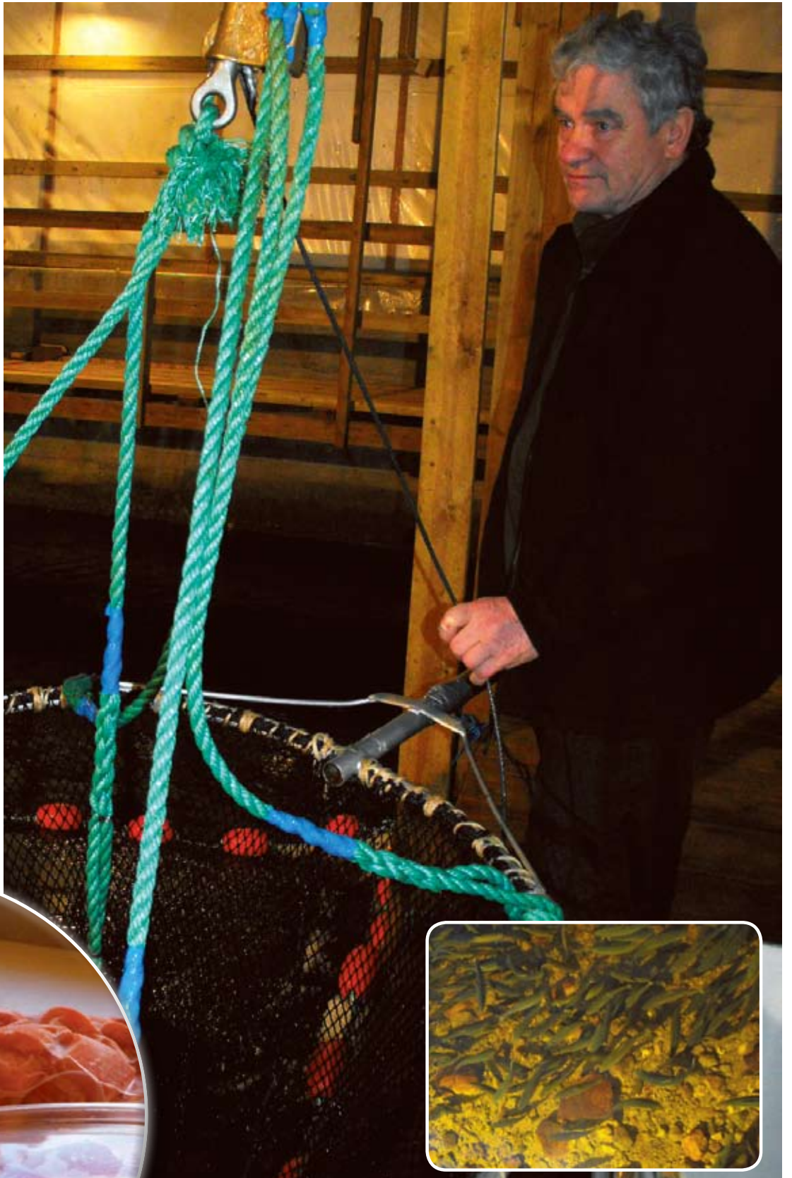
Nostohaavi on kovassa käytössä joulun aikaan, joka on toinen sesonki kevään lisäksi. Karhutunturin Lohi Oy:n tuotteita: mätää, graavilohia ja lohikuutioita.

Molemmat arvostavat sitä, että työtä saa tehdä kotikylällä ilman pitkiä työmatkoja.