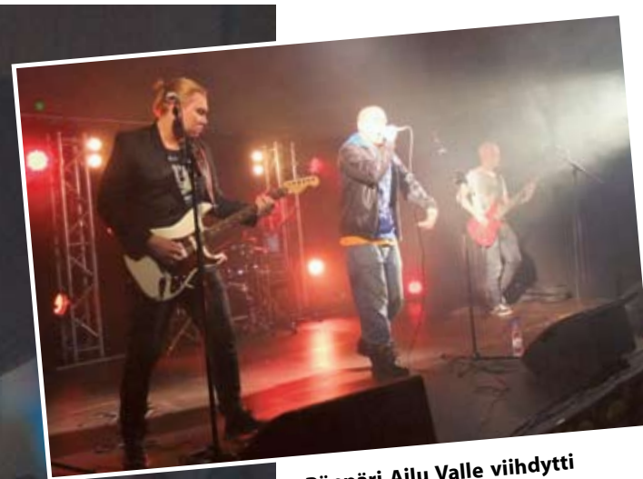
Räppäri Ailu Valle viihdytti pujottelun nuorten SM-kisojen gaalaan osallistuneita.