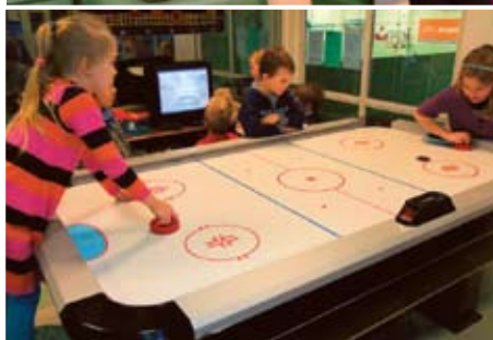
Pallokerhossa riitti iloa ja vauhtia. Ryhmässä kävi yhteensä noin 30 lasta.