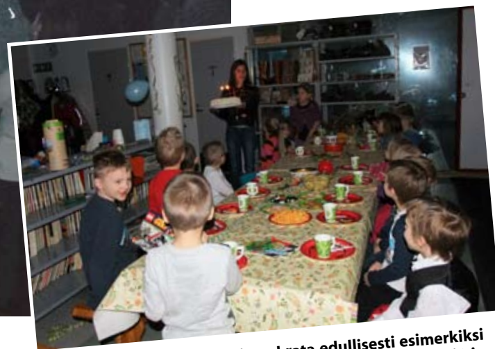
Liikuntakeskuksen tiloja voi vuokrata edullisesti esimerkiksi synttäreiden järjestämiseen. Hallissa on tilaa juosta, leikkiä ja pelata. Synttäreiden järjestäjä vastaa itse tarjoiluista.