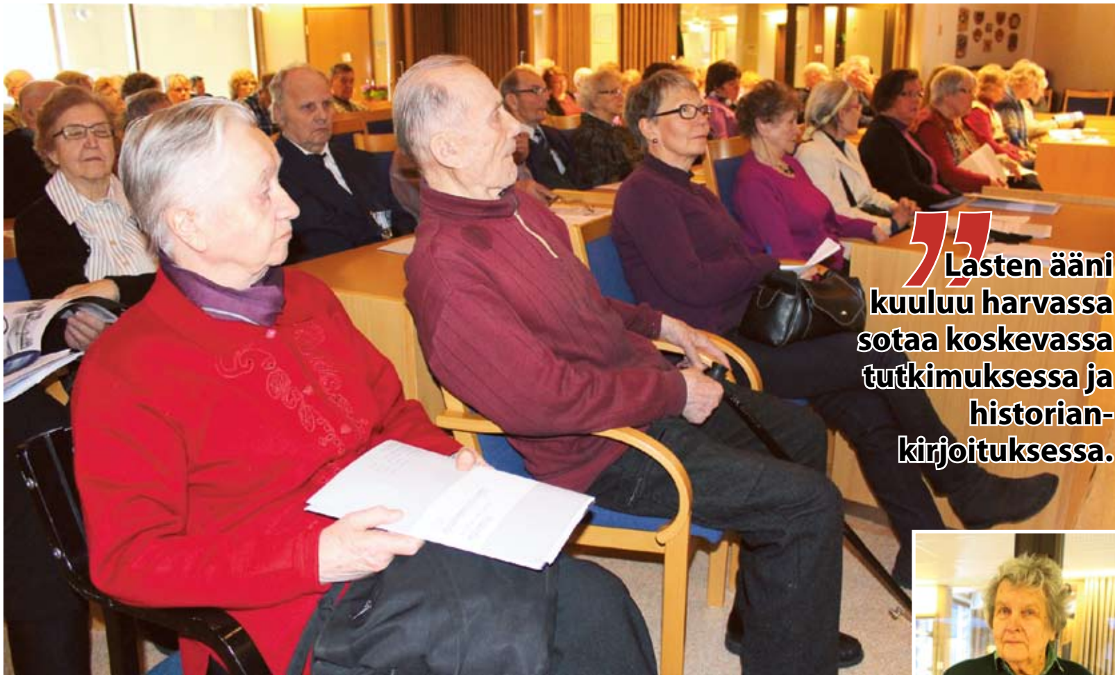
Seminaarissa oli mukana monia sota-ajan kokeneita.