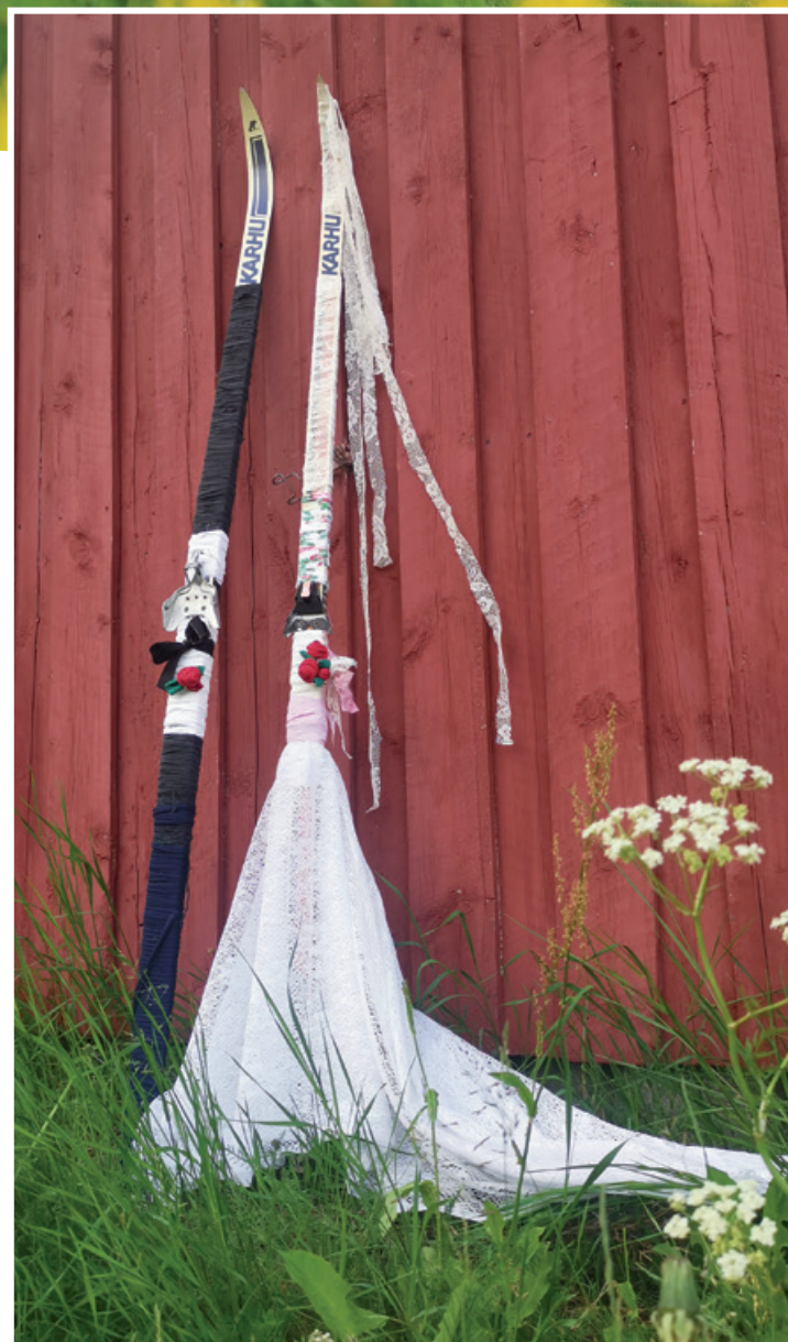
”Karhujen häät” -niminen taideteos Saijan kylällä.

Pohjoisen uudet polut on osa STM:n rahoittamaa ”Kulttuurihyvinvointia ikäihmisille” IKO-hanketta, jota toteuttavat TAIKE, Teatterikeskus ja sen jäsenyhteisöt, Kulttuuria kaikille -palvelu ja Aili-verkosto.