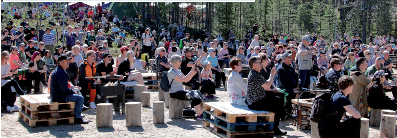
Sallan luontokeskukseen kokoontui arviolta 1500 ihmistä nauttimaan kauniista säästä ja avajaisten ohjelmasta 11.6.2022.