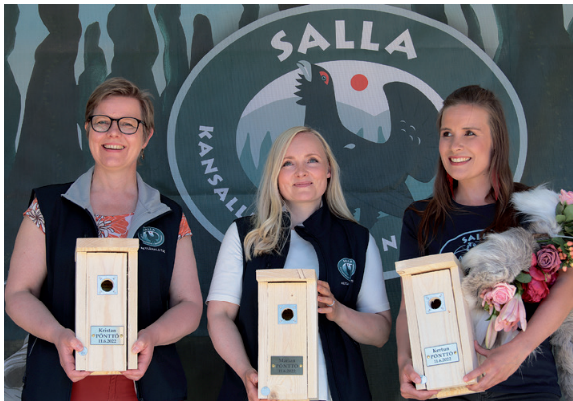
Sisäministeri Krista Mikkonen, ympäristö- ja ilmastoministeri Maria Ohisalo sekä avajaisten juontaja, meteorologi Kerttu Kotakorpi saivat omat nimikkolinnunpönttönsä ripustettavaksi Sallan kansallispuiston alueelle.

Eduskunta on myöntänyt Sallan kansallispuiston perustamiseen 4,5 miljoonaa euroa vuosille 2021–2023. Kansallispuistopäätöksen turvin tuodaan retkeilypalvelut kansallispuistotasolle. Retkeilypalvelujen kehittämällä on myönteisiä talous- ja työllisyysvaikutuksia, koska työ teetetään pääosin ostopalveluina ja urakoiteina.