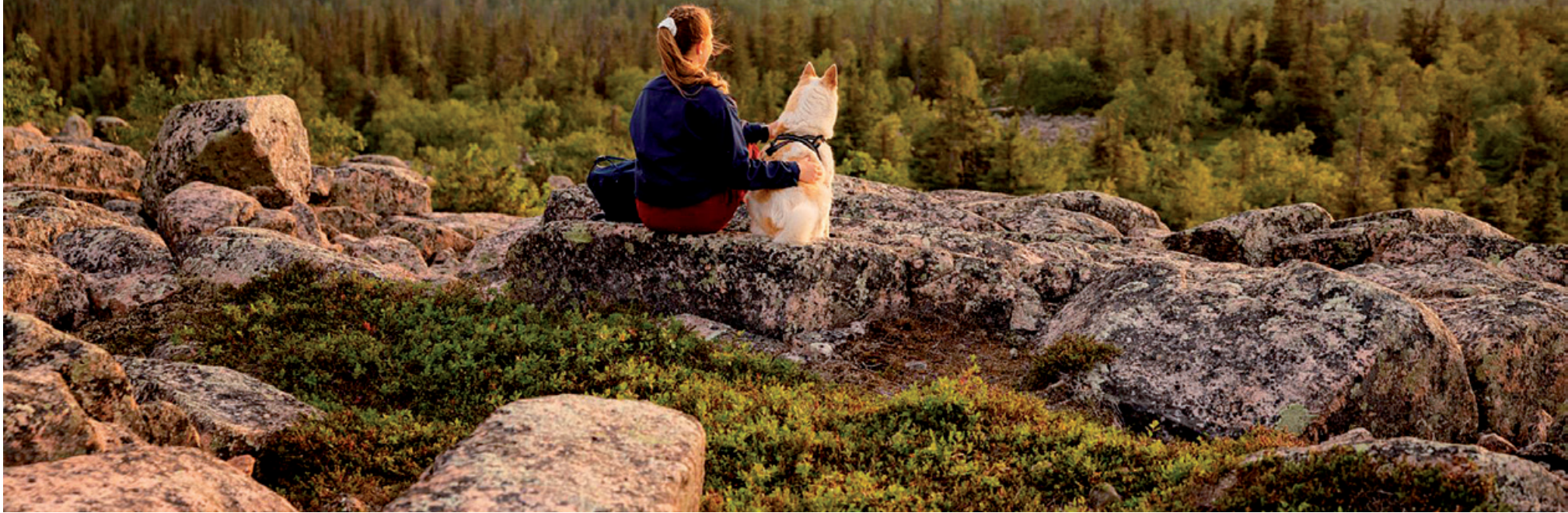
Nainen ja koira istuvat kivellä.

Sallan kansallispuiston vuosisatoja vanhat ikimetsät ulottuvat rotkolaaksosta soille ja ylängöille. Retkeilyreitit vievät jääkauden muovaamille harjuille ja kuruille sekä kirkasvetisille lammille. Iso Pyhätunturin huipulta voit ihaila laajalle aukeavia maisemia ja Venäjällä siintäviä tuntureita. Hiljaisen erämaan yöllistä taivasta valaisevat linnunradan tähdet ja revontulet sekä keskiyön aurinko kesäisin. Talviset tykkymetsät salpaavat hengityksen. Tämä on ukkometson ja koppelon koti – keskellä ei mitään.