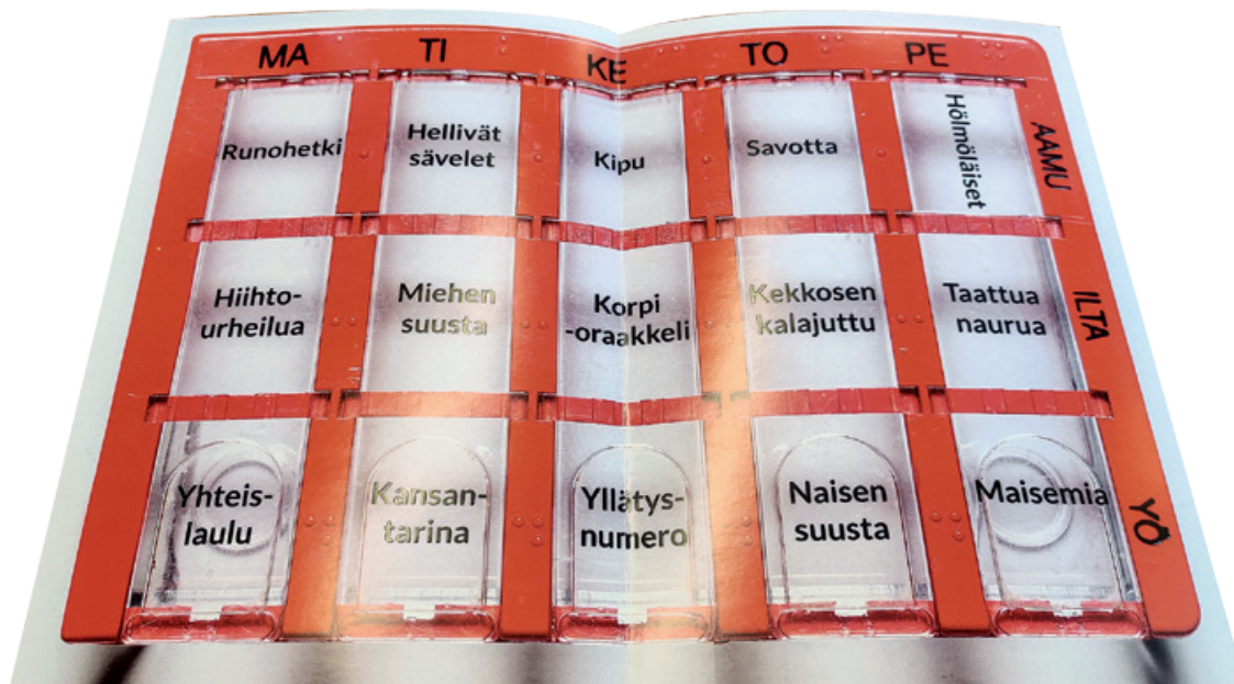
Piipahtajien taide- ja kulttuuridosetti.

Pirtissä piipahtajat esitys on osa Pohjoisen uudet polut 2 – hanketta, joka keskittyy ikäihmisten kulttuurihyvinvointiin. Hankkeen tuottaa ja sen koordinoinnista päävastuussa on Sallan kunnan kulttuuripalvelut. Sallan kuntakumppanina hankkeessa on Posion kunta ja kumppanina kulttuurihyvinvoinnin sisältöjen toteuttamisessa on taideammatt-