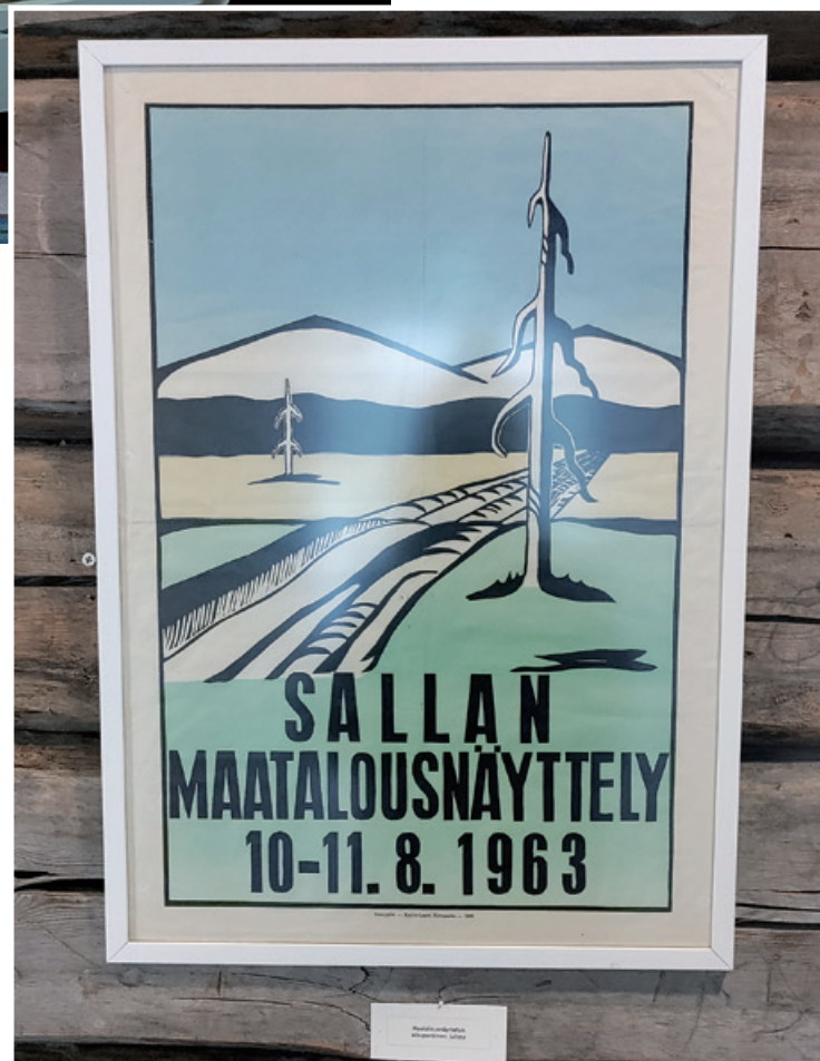
Kuva ja tekstit: Ines Knaster

Tervetuloa tutustumaan näyttelyyn, vierailemaan museossa ja sen yhteydessä nauttimaan perinteiset kampanisukahvit museon kahvilaan! Muistatthän, että museossa sijaitsee Sallan paras kirjakauppa. Museokaupasta löytyy myös hyviä lahjaideoita äitiänpäiväksi. ■