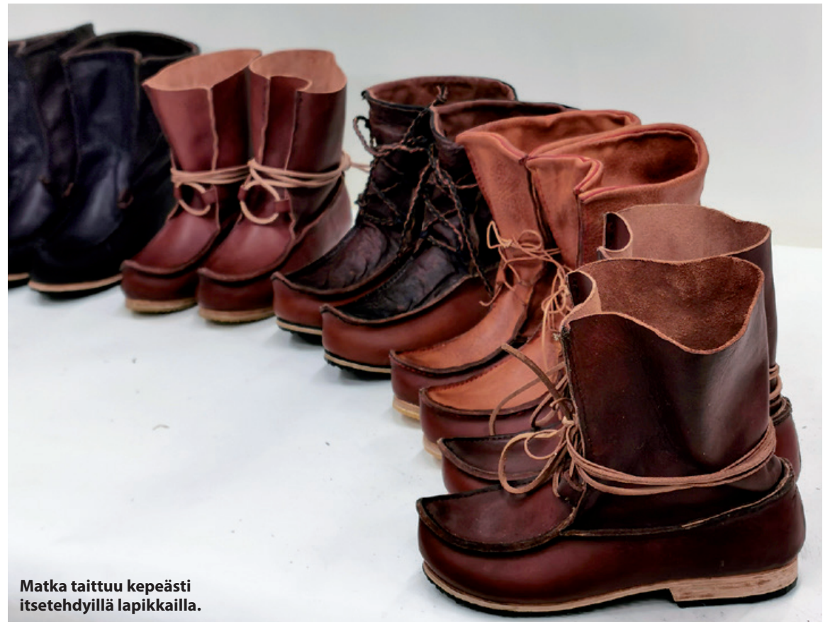
Matka taittuu kepeästi itsetehdyillä lapikkailla.

Niin ja monille kursseista voit tulla yhdessä myös lapsen tai nuoren kanssa. Kun lapsi tai nuori tulee yhdessä kurssille maksavan aikuisen kanssa, niin kurssimaksu on 50% normaalista. ■