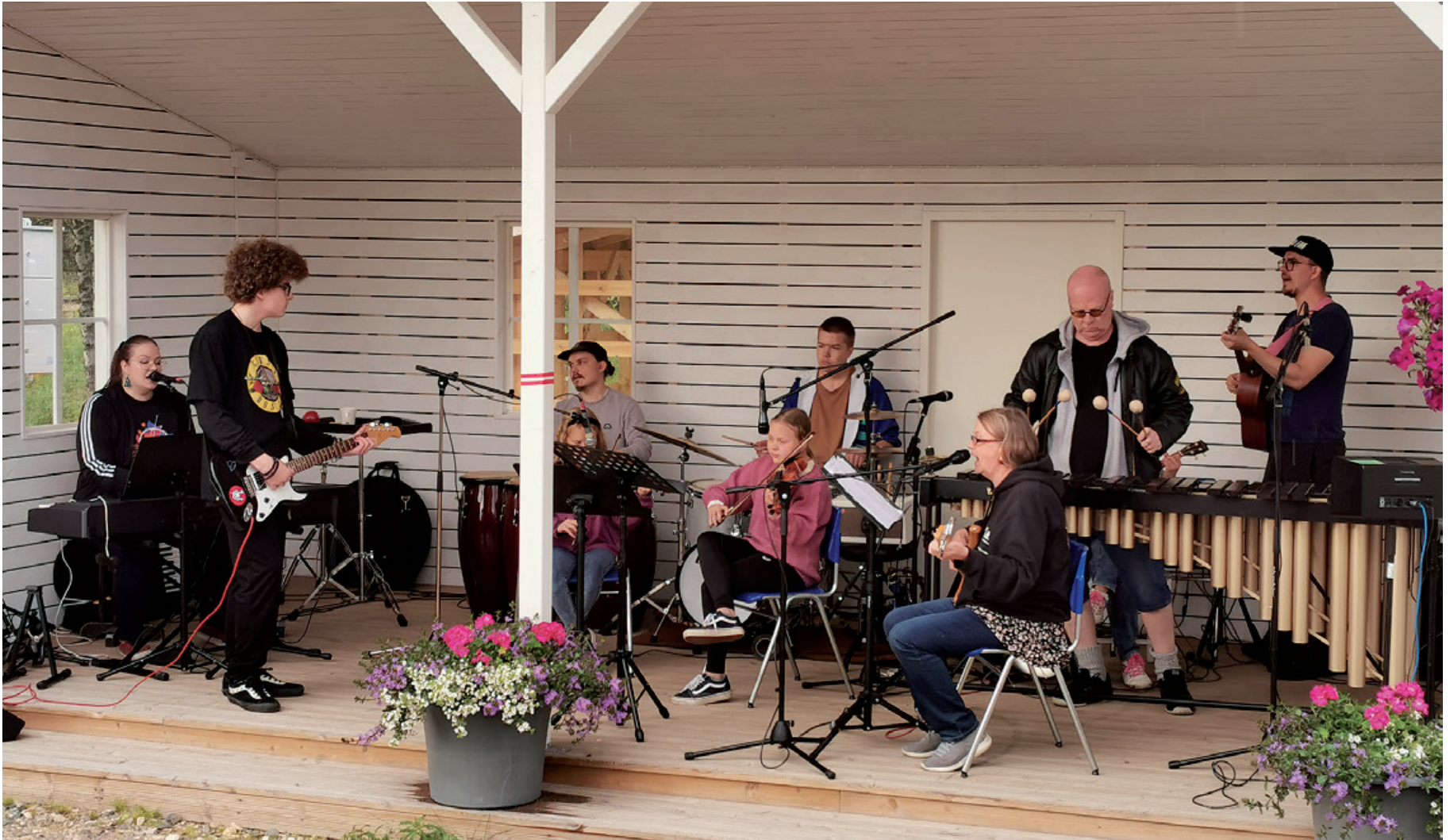
Musiikkileirin päätöskonsertista vuodelta 2022.