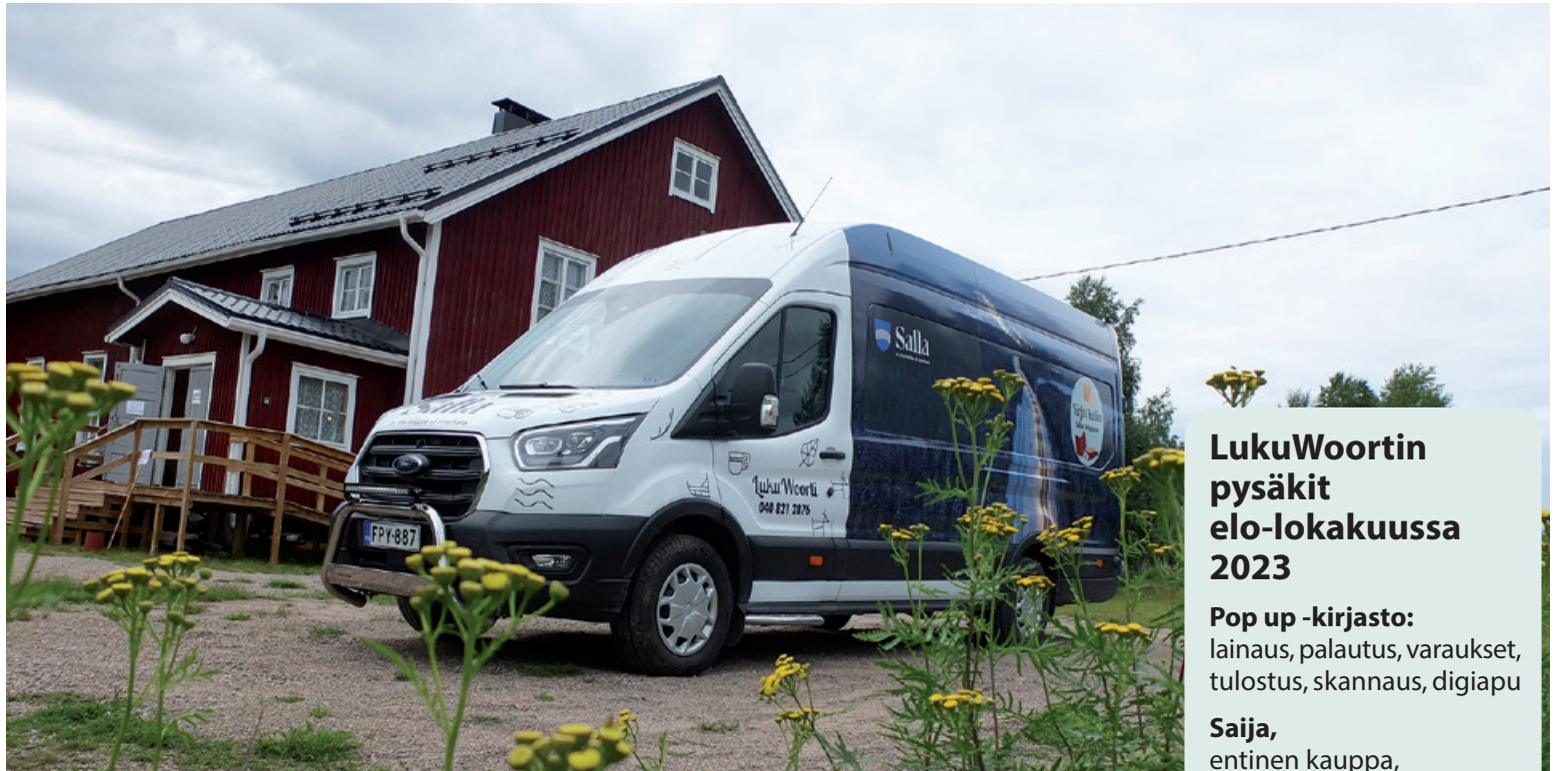
Lukuwoorti on minikokoinen kirjastoauto, jonka asiakas voi halutessaan pyytää pihaansa ja valita lukemisensa sieltä.

” Omatoiminen Kirjat kotiin -asiakas voi tämän jälkeen varata itse haluamansa kirjat verkkokirjastosta ja odottaa, että ne toimitetaan kotiovelle sovittuna päivänä. Aikaisemmat lainat voi samalla palauttaa.