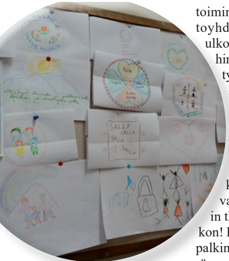
Piirustuskilpailusta saatiin paljon hienoja ehdotuksia perhekeskuksen logoa varten. Uusi logo julkaistaan Salla-päivillä.

Kesän avajaisissa korostettiin osallisuutta ja tapahtumassa olikin monta toimintapaikkaa. Kansalaisopiston huovutuspiisteellä kävi kova kuhina, kun lapset ja aikuiset saivat osallistua taideteoksen tekemiseen neulahuovuttamalla työhön oman osuutensa. Myös perhonsidonta