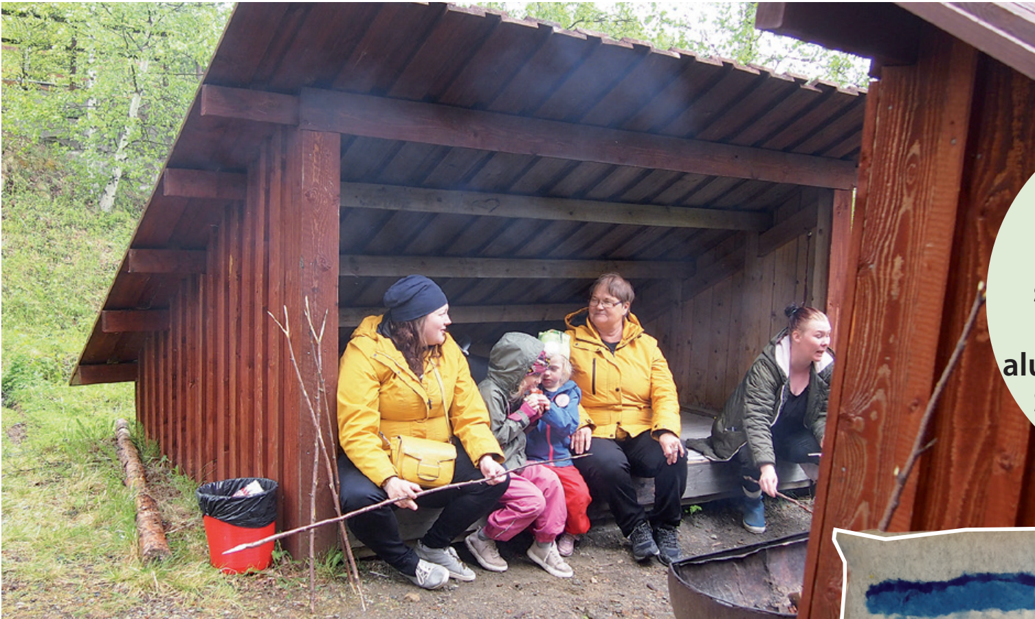
Kesän avajaisiin kokoontui väkeä kylmästä säästä huolimatta. Makkaraa sai paistaa ulkonäyttelyalueen laavulla.

” Tapahtuman tarkoituksena oli kertoa kuntalaisille mitä palveluita kunta, hyvinvointialue ja kolmas sektori Sallassa järjestävät.