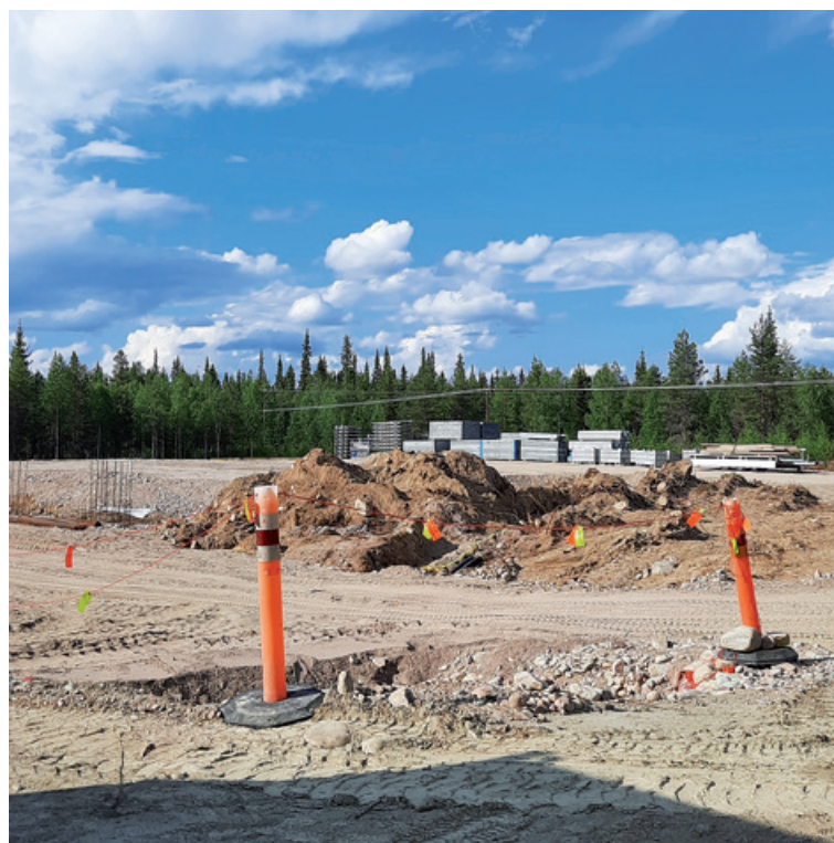
Sallan uuden ecoASEMAN rakennustyöt ovat käynnistyneet kesäkuussa.

Lapeco Osmo Aikio, toimitusjohtaja puh. 0400 516 237 Aila Kauppila, viestintäpäällikkö puh. 040 130 7466 sähköpostiosoitteet ovat muotoa etunimi.sukunimi@lapeco.fi