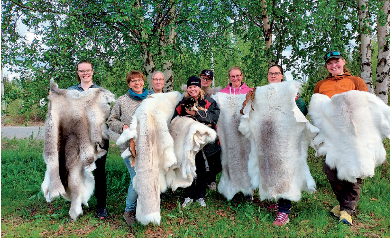
Tyytyväisiä kurssilaisia valmiiden taljojen kanssa.

” Perinne- parkitus on ekologisesti kestävä ja eettinen vaihto- ehto teolliselle nahanvalmis- tukselle.