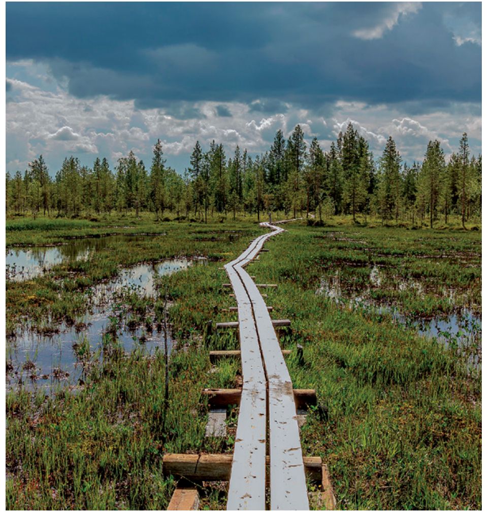
Kiviaavan partisaani-iskun muistomerkillä johtavat pitkospuut on uusittu.