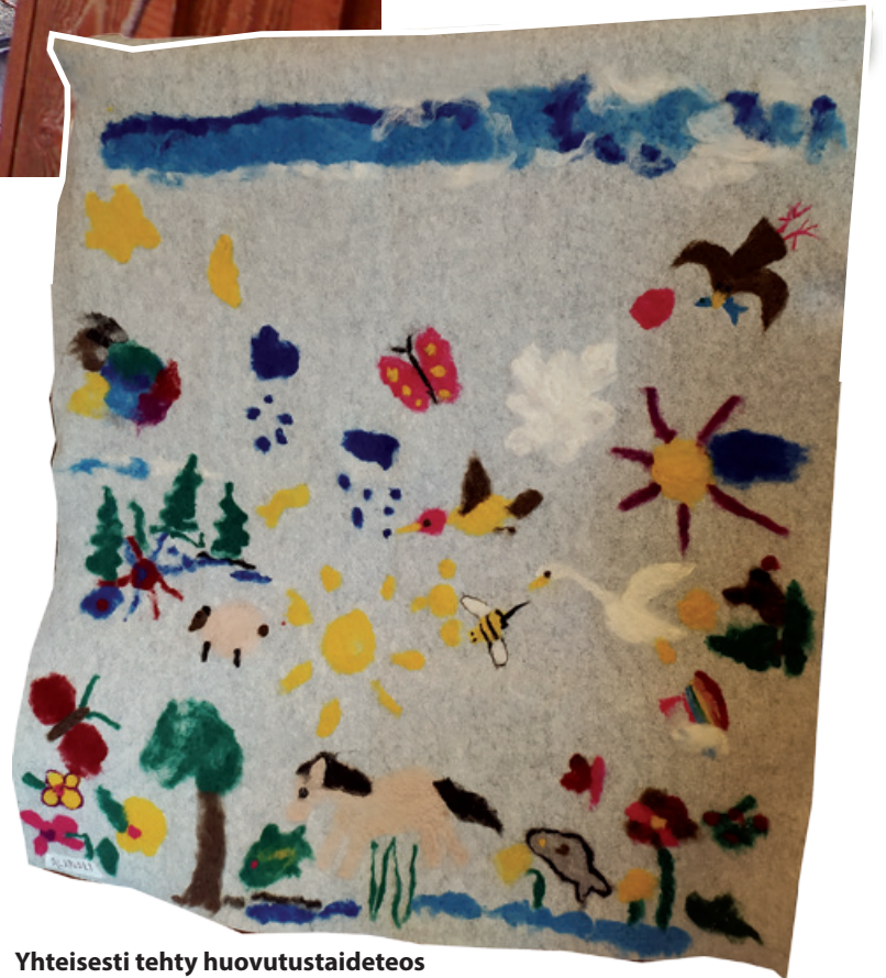
Yhteisesti tehty huovutustaideteos pääsee näytille kunnanviraston seinälle.

Osallisuuden teemaan liittyen kesän avajaisissa oli myös kysely, jossa sai avoimesti kertoa mikä Sallassa on hyvää tai huonoa tai toivoo jotain tiettyä asiaa tai palvelua. Asiaita sai kirjoittaa lapuille anonymisti tai ihan nimen kera. Samalla kysyttiin myös, onko kuntalaisilla tarvetta